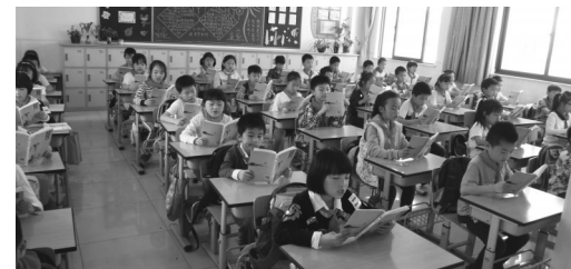
2014年上海市民文化节诵读大赛在全市中小学掀起了读中华经典的热潮。

路漫漫其修远兮,中华传统经典诵读大赛是传承中华经典的一次有益尝试。在传承中华民族优秀传统文化的漫长道路上,上海将持之以恒地继续探索、努力实践。