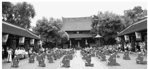
2014年上海市民文化节主体活动之一——孔庙传统礼仪活动现场,青少年共同跳起孔子乐舞。

丰富办赛内涵,用核心价值观检验节日效果,是2014年上海市民文化节中华传统经典诵读大赛的不懈追求。中华传统经典诵读大赛紧紧地把握社会主义核心价值观,突出传统经典诗文中道德、情感、美感、意蕴、声韵等体现系统的、全面的、可感知的、可吟咏的文化内涵。相较于去年首届市民文化节舞台上的热闹,今年的市民文化节,注重的是对市民文化素养和知识涵养的提升,“听、说、读、写”四大系列十个市民赛事项目,线上线下深度互动,推动市民多阅读、品经典、知传统、说梦想、写美文,在提升市民个人文化内涵与底蕴的同时,助推城市文化走向深耕厚植。赛事采取政府主导、各方参与,社会主体协作的操作机制,邀请上海秋霞圃传统文化研究院协助举办,不仅