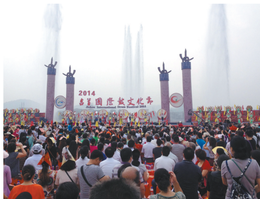
2014吉首国际鼓文化节开幕式现场。

“土家苗乡特色浓,处处听闻击鼓声”。吉首是一座和“鼓”有着不解之缘的城市,在吉首,随处可以看见男男女女挥舞鼓棒,激情舞蹈,以生动的舞