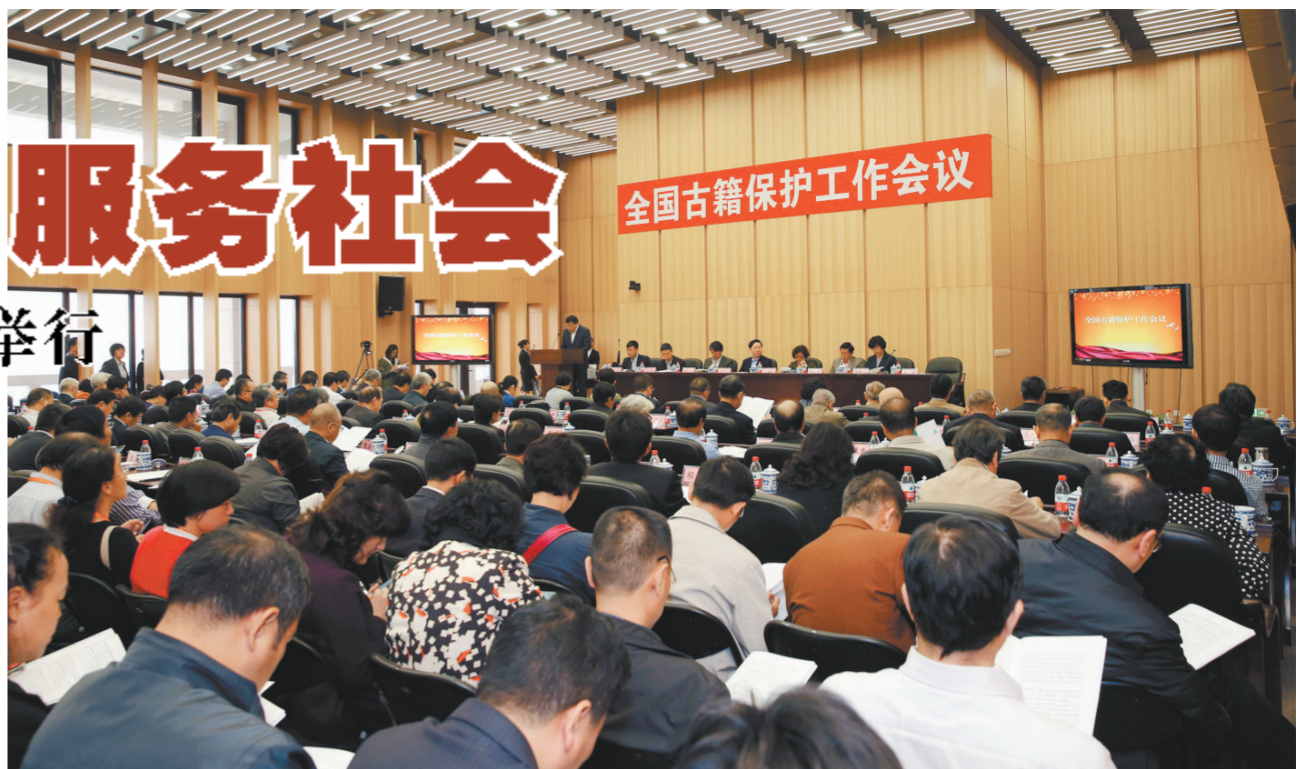
全国古籍保护工作会议现场

党的十八大以来,习近平总书记从中华民族伟大复兴的战略高度,深刻阐述了中华文化与民族复兴、中华文化与