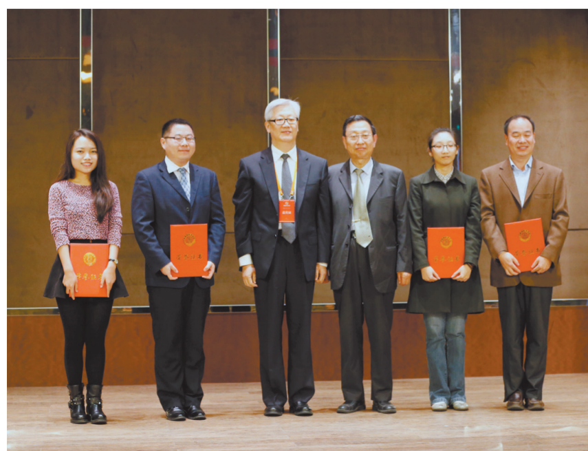
“我与中华古籍”有奖征文活动颁奖仪式现场

由光明日报社、国家图书馆(国家古籍保护中心)共同举办的“我与中华古籍”有奖征文活动,10月10日在2014中国图书馆年会中华优秀传统文化论坛(名家论坛)上正式揭晓,主办方公布了获奖名单并向获奖代表颁发了证书。“我与中华古籍”有奖征文活动自今年4月启动以来,受到社会各界广泛关注,共收到海内外来稿1500余篇。投稿者来自各行各业,既有高校教师、科研人员、古籍保护工作者,也有工人、农民、军人、公务员、学生等,年龄最长的90岁,最小的才8岁。稿件内容丰富、故事精彩,有的分享古籍阅读心得,有的抒发古籍收藏体会,有的讲述古籍修复、保护工作经验。