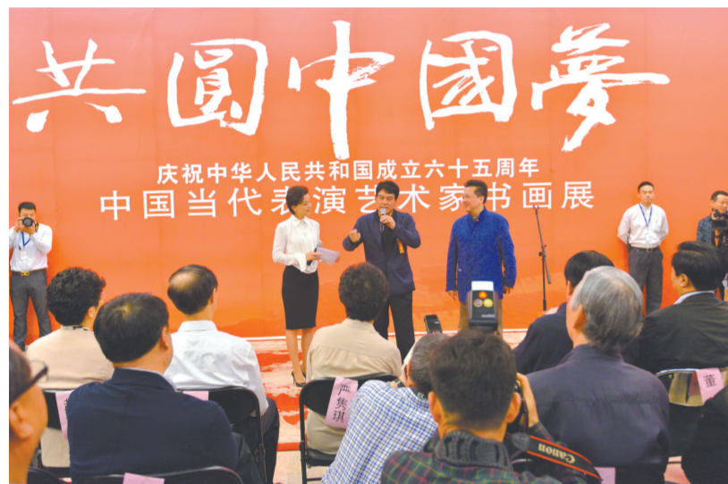
9月29日，展览在中国美术馆开幕，图为开幕式现场。术家参观此次展览。

我理解的“精品”，应该代表一个时期或一个时代的精神，具有现实的合理性和价值判断。首先，它应该具有典范性，又能够体现出一种相对高度、深度和广度。同时，作品的结构和形式和语言既有鲜明的个性和成熟的审美理想，又能够产生不可替代的影响力。此外，除去作品自身的艺术价值，还有深邃的美学价值和精神要义，既是一个时代的标志，也是一个特定时期的历史折射。因此，我们不赶时髦，不急功近利，而是坚持标准和质量。我们公司的名人名家都是各自领域卓有成就的专家名流，无论是文艺演出节目的编制，还是电影、电视剧的制作，层次很高，分量很重。我想，这些优势都是我们推出精品力作的基础。