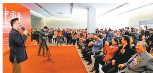
10月12日，展览赴黑龙江巡展。