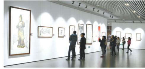
10月15日，大批观众在哈尔滨哈药当代美术馆参观此次展览。