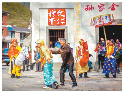
杭州余杭百丈镇石竹园村文化礼堂民俗活动

四是强化考核,规范运行,在综合利用上“提质增效”。为提升乡镇综合文化站服务效能,余杭在创新举措、优化管理上狠下功夫。除继续保持对乡镇综合文化站的考核作为单独一项,纳入区委、区政府对镇、街道年度工作考评,