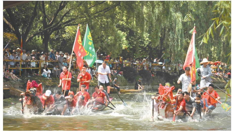
杭州余杭举办非遗民俗活动龙舟盛会