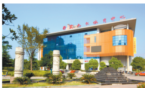
杭州余杭崇贤街道综合文化站大楼建筑面积5600平方米

在100分总分中占4分外,每年由区文广新局按当年文体工作要求制定考核细则,所有考核结果都跟镇、街道年度排名及扶持补助挂钩,从而起到了很好的指挥棒作用。出台了《余杭区公共图书馆镇、街道分馆考核实施细则》、《余杭区文化馆(站)业务干部服务基层考核办法》、《余杭区公共图书馆镇、街道分馆文献流转管理办法》等政策,进一步规范乡镇综合文化站服务内容,促进公共文化服务向广覆盖、高效能转变。