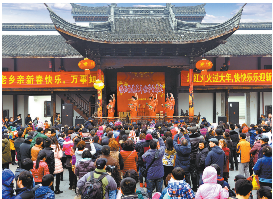
杭州余杭塘栖镇大运河畔的古戏台年节演出人气爆棚

五是打造品牌,扩大交流,在宣传途径上“多头齐上”。通过持续多年的规范化、科学化建设,余杭乡镇综合文化站立足基层、承上启下的辐射带动作用日益明显,基层形成浓郁的文化氛围,文化项目品牌突出。所有镇、街道都定期举办文化艺术节和人民运动会,镇、街道举办“一节一会”时间最长的已超过23年;超山梅花