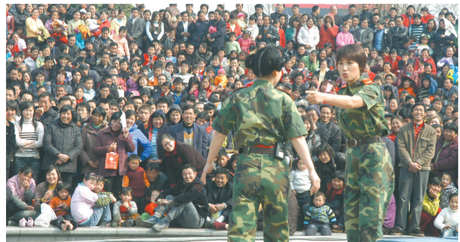
杭州余杭广场文艺演出