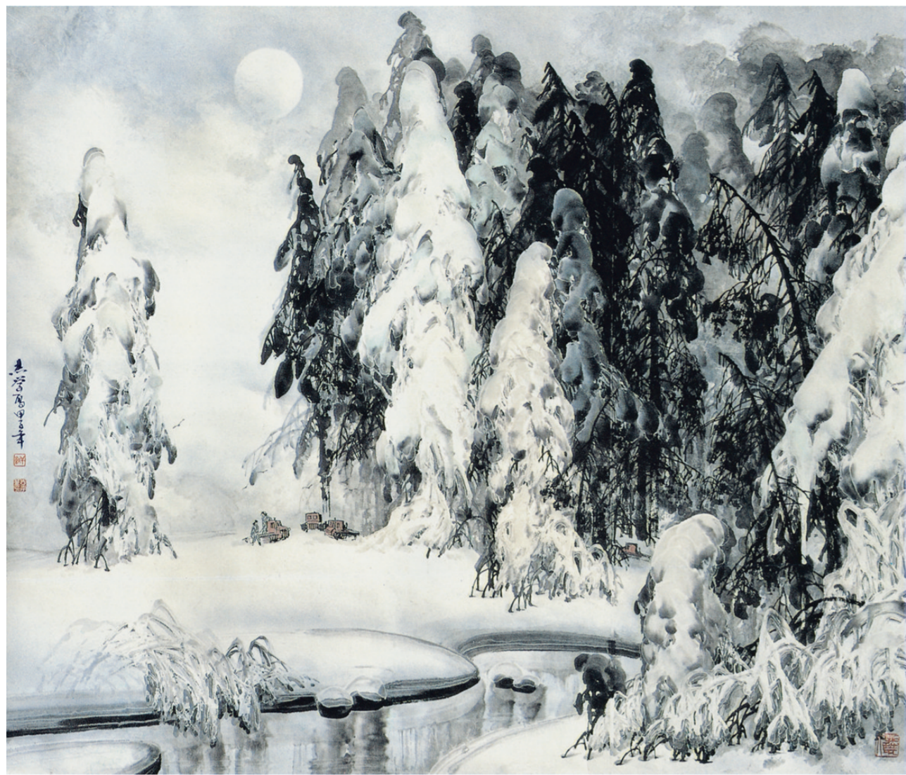
于志学《青河兴安》1984年

张晓凌(中国国家画院副院长):冰雪画派在于志学先生的带领下,经历了30年发展,取得了重要成果。于志学先生最突出的贡献不仅是他创立了一个全新的画种,同时包括带起一批人创立了冰雪画派。冰雪画派是以一种独特观念、题材和语言系统形成的画派,我认为其更贴近西方现代画派,后者是以某种理念和人的创新精神为主导形成的,冰雪画派在这点上也非常独特。