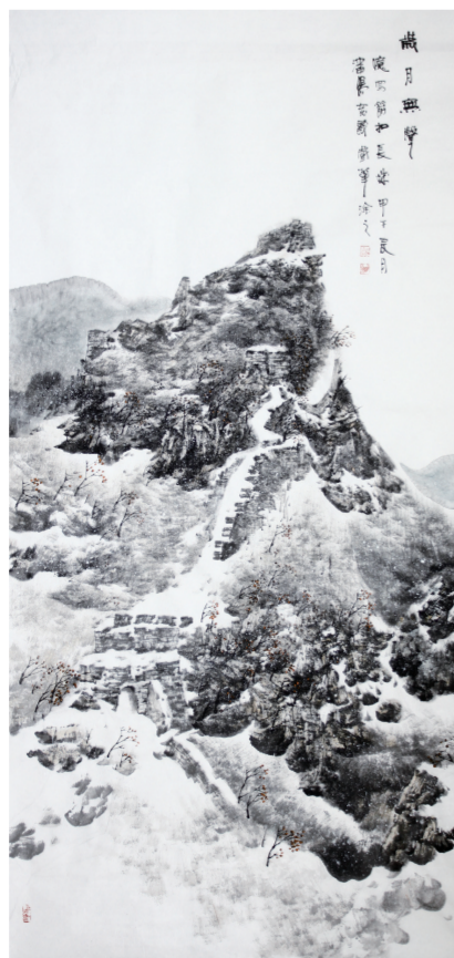
汤宽义《岁月无声》2014年