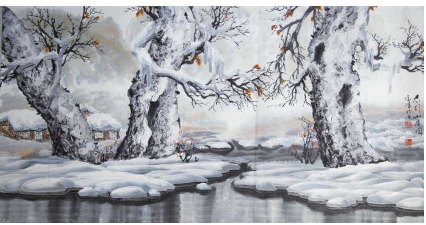
高俊峰《太行山居图》2013年