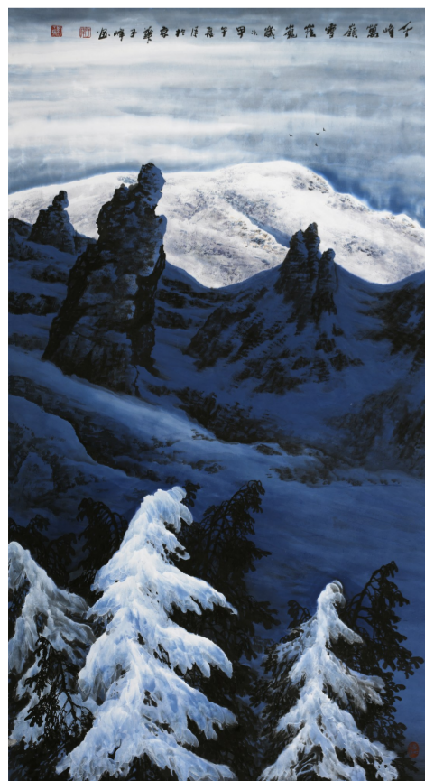
刘丁瑞《千峰万岭》2014年