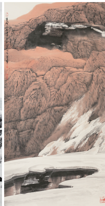
周尊圣《生命之泉》2004年