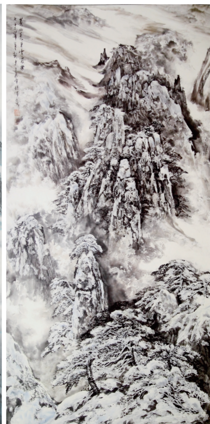
张军《黄山景色云霞披》2012年