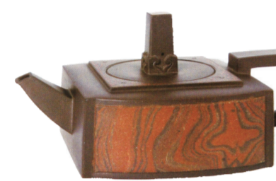
天柱壶(紫砂) 王建中