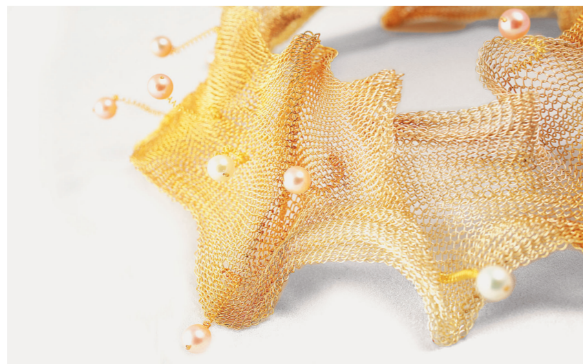
衍异系列作品(铜镀足银、足金、珍珠) 2009年 张凡

金箔，除了用来贴，是否还可以有别的可能？张凡的贴金行为通过掩饰和提拔赋予出场所隐含的权利，这些随时可以被弃用的贴身之物，经张凡之手染金出场，无疑还是成为了一种贴近人