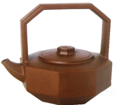
钻石提梁壶(紫砂) 王建中