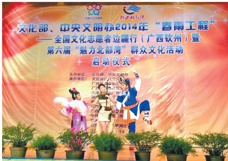
文化志愿者演绎湘琴湘韵

10月14日,由文化部、中央文明办共同举办的2014“春雨工程”——全国文化志愿者广西行暨“大地情深”——群星奖广西、湖南、海南获奖作品巡演活动在广西钦州市举行。本次活动持续8天,分别在广西钦州市、玉林市、柳州市、桂林市4市举行巡演巡展巡讲。