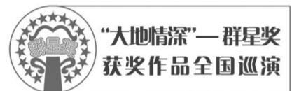
“大地情深”群星奖获奖作品全国巡演