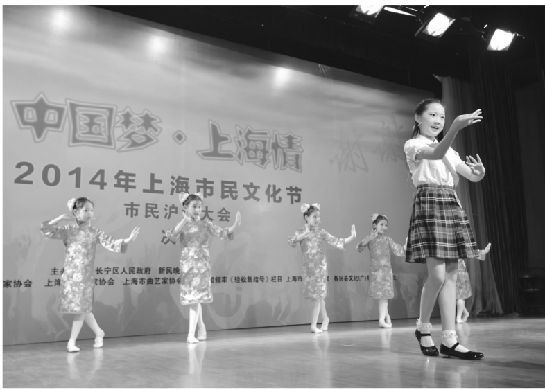
2014上海市民文化节沪语大赛决赛现场,孩子们在用曲艺和舞蹈的形式展示她们热爱的乡音。

从今后的创作角度来讲,各位编导表示也颇有收获。“从此次受邀参演的作品可以看出,好的作品必须要接地气、有高度、传递正能量。”曹光涛说,正如习近平总书记在文艺工作座谈会上讲到的,人民是文艺创作的源头活水,一旦离开人民,文艺就会变成无根的浮萍、无病的呻吟、无魂的躯壳。