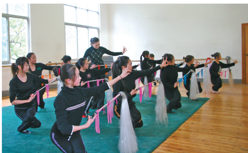
湖南艺术职业学院戏曲身段课堂教学

政策支持不到位。一是顶层设计尚不到位。大家普遍认为,湖南对戏曲教育的发展与扶持,缺少全方位调研与思考,缺乏系统思维。二是办学投入不足。原湖南的几所艺术院校,因经费投入不足,办学空间狭小,办学条件简陋,实习实训设施与设备陈旧。全国有十来个省份实施戏剧生免学费政策,并建立了专门的奖励基金,以吸引优质生源,但湖南这一方面至今还没有动静。三是政策设计有漏洞。一方面,现行的国家中职助学金资助政策规定资助时间只有两年(主要针对3年制中专而言),没有考虑到戏曲专业人才培养和学制的特殊性