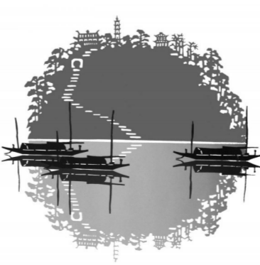
王德林剪纸作品《桐君春色》