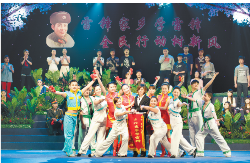
雷锋艺术团演出歌舞情景剧《这是我应该做的》

送来了大型流动舞台车，添置了几十万元设备，促使艺术团与长沙市湘剧院艺术学校合作，流动吸收新演员。在体制转变上，帮他们找到了“养项目不养人、节省开支出精品”的路子。又为其聘请了十几个乡间能人做特约编剧，组织他们为剧团投稿。万事俱备，雷锋艺术团扛起送戏大旗，为几百万群众送去快乐、文明、和谐。一送就送了13个年头。此外，每年抗洪救灾，剧团都走上最前线，就地搭上最简易的舞台，在风雨里为抗洪勇士们鼓劲加油。