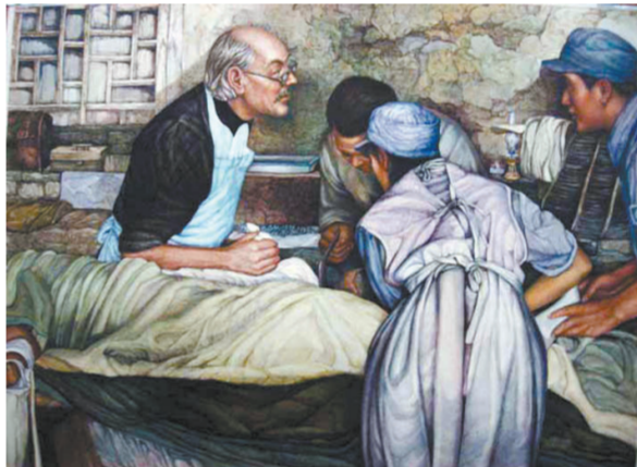
手术中的白求恩(油画)