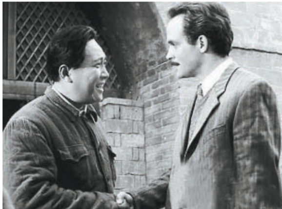
电视剧《诺尔曼·白求恩》剧照