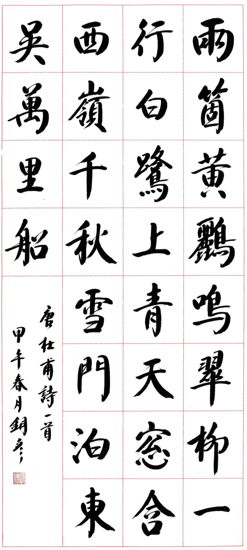
唐杜甫詩二首 甲午春月銅彦書

第一位,不被名利金钱所困,不被歪风俗气所扰,浓墨重彩地弘扬主旋律、传递正能量,大写真善美、抵制假恶丑;要始终保持光大传统文化的饱满激情和严肃态度,紧紧跟上时代发展步伐,不断攀登书法艺术高峰,努力创作出既被专家认可,又深受人民群众喜爱,经得起历史检验的优秀作品。真正用富有鲜明个性特征,具有精湛艺术水准,能启迪思想、温润心灵、陶冶人生的精品佳作,向社会奉献,为人民服务、给时代树碑。