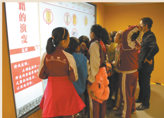
融入不同时期文字载体、书籍装帧形式的“连连看”