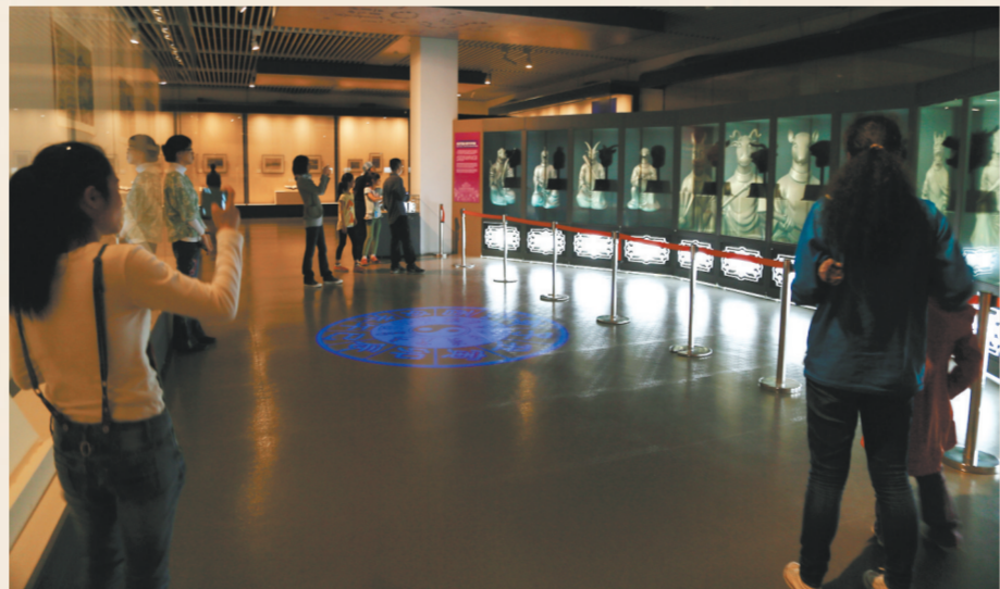
三山五园文化巡展——圆明园四十景文化展