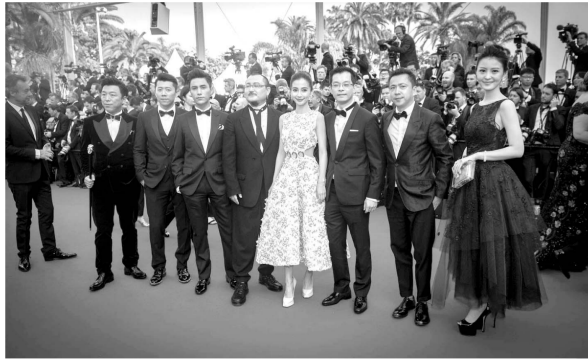
5月13日,第68届戛纳国际电影节在法国南部海滨城市戛纳拉开帷幕。法国女导演艾玛纽埃勒·贝尔克作品《高昂的头》作为开幕影片,在简短的开幕仪式后进行了放映。图为在法国戛纳,电影《寻龙诀》剧组出席电影节开幕式。

不过,国内电影公司采取阶梯式分账模式的出发点和好莱坞并不一样,其实是为了“以收入换市场”,通过给影院更高比例的分账来换取排片,争取更高的票房。对于华谊这样的上市公司,与高票房带来的话题、提高的股价带来的收益相比,那点票房分成的损失根本不算什么。