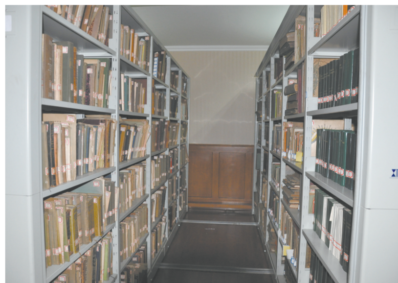
登记后的馆藏图书