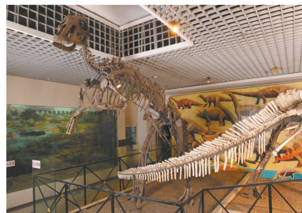
平头鸭嘴龙骨架化石