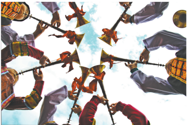
贵州省天柱县的侗族群众非常珍视本民族的文化，虽然时代在发展，但侗族文化在这里得到了很好的传承。如今，在当地政府和社会各界的共同推动下，侗族文化已从山野走进校园，“呵呀呀”的唢呐声、“啊呀呀”的侗歌声让人流连忘返。图为当地石洞小学的学生正跟随学校聘请的民间艺人学吹唢呐。

届非遗传统美食节上，近40项广东传统食品、名吃特产汇聚在一起，市民游客在品尝美食的同时，还能了解到这些传统美食的制作技艺；在南社明清古村落举行的传统非遗技艺展示更让大家领略到了“茶山泥公仔”“红漆插花传统展”“石龙醒狮头”等非遗项目的魅力。（丘想明）