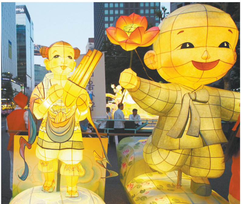
5月16日，人们在韩国首尔市中心参加花灯游行。当日，首尔市中心举行大规模花灯巡游活动，迎接即将到来的佛诞节。新华社记者 姚琪琳 摄