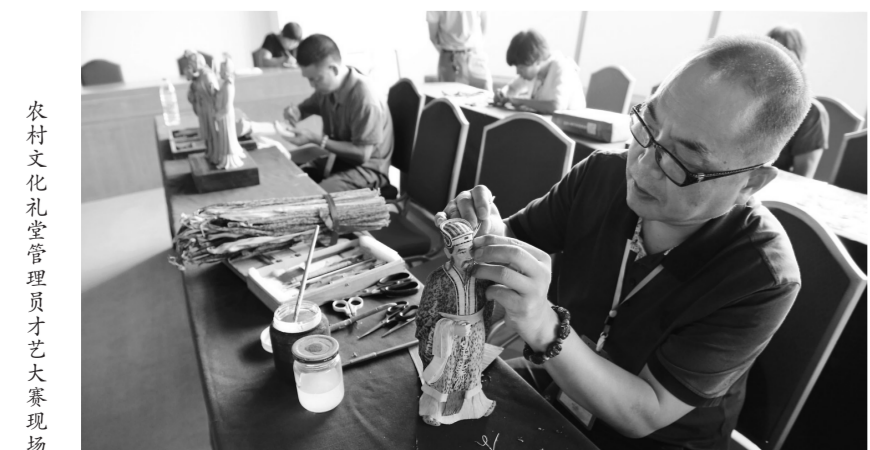
农村文化礼堂管理员才艺大赛现场

近年来,浙江省文化厅十分重视全省公共文化服务和群众文化队伍建设。农村文化礼堂管理员作为文化礼堂的“管家”,在建队伍、播文化、聚人气上起到了积极的作用。为提升农村文化礼堂管理员队伍素质,浙江省文化馆举办了多期农村文化礼堂管理员培训班,各市、县(市、区)文化部门也多次组织农村文化礼堂管理员进行充电。此次大赛不仅是对浙江省文化礼堂管理员业务水平的全面检阅,也是对全省农村公共文化服务能力的全面提升。