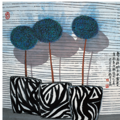
参天的妙写新(国画) 周韶华

9月11日,“大美山河——周韶华艺术精品展”在北京保利艺术博物馆开幕。展览从“大美于心”“梦里心花”两个维度出发,展出作品45幅。他的创作题材广泛,但其中雄浑、大气、开阔、大美的画风却始终没有改变。86岁的周韶华表示,“生活现场即艺术现场”,他多次走进西部,寻访中华文明的源头,极大地充实了对“大美”的个体感悟。(天颖)