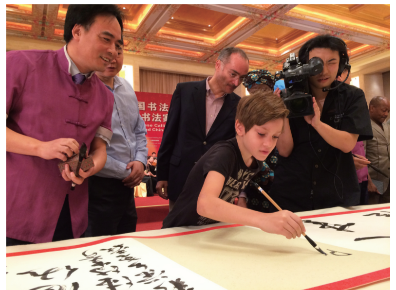
驻华使节及子女参与书写