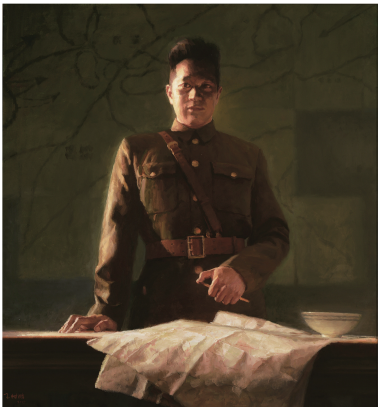
叶挺将军(油画) 140×130厘米 王树鹏