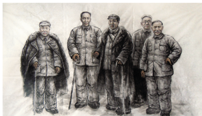
延安五老(国画) 200×300厘米 薛丕丞