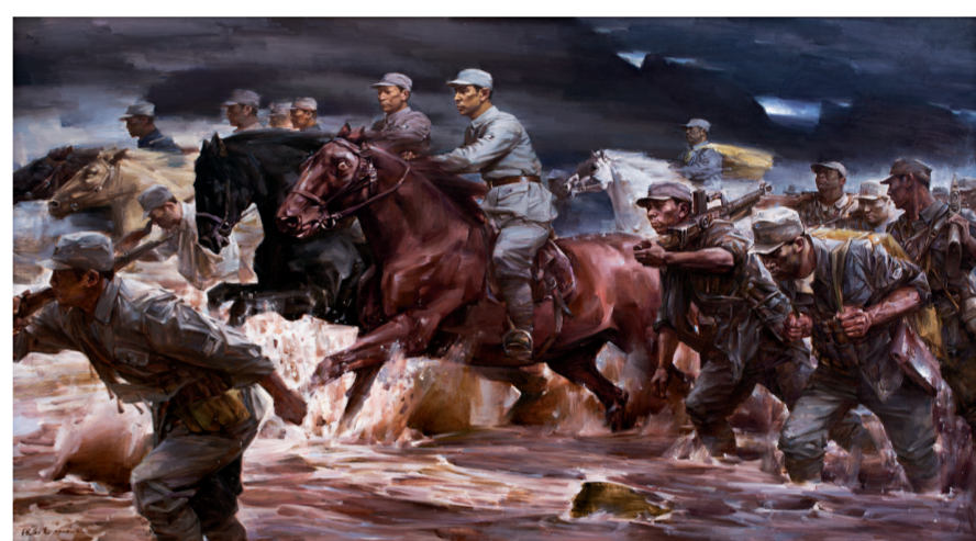
激流·八路军115师奔赴平型关(油画) 120×200厘米 张庆涛