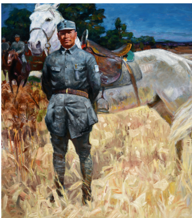
彭雪枫将军(油画) 150×150厘米 曹新林