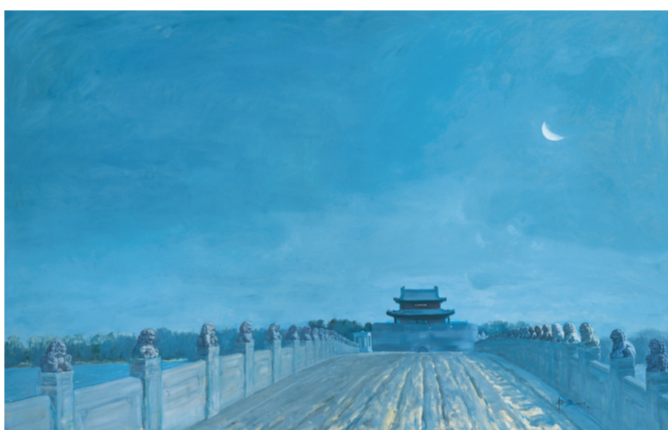
抗战遗址·卢沟桥(油画) 190×300厘米 杨尧