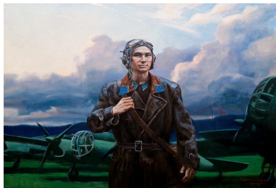
苏联援华轰炸机大队长库里申科(油画) 150×200厘米 王铁牛