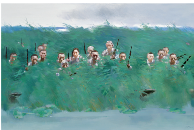
水上雁翎队(油画) 120×180厘米 陈世宁