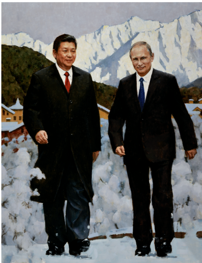
索契共识(油画) 220×170厘米 谷铜