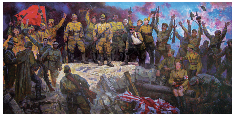
攻克虎头要塞(油画) 211×400厘米 吴云华