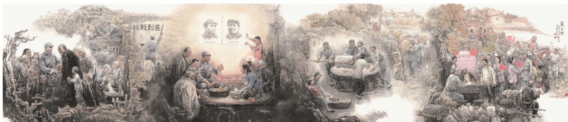
巍巍太行(国画) 175×801厘米 赵志田