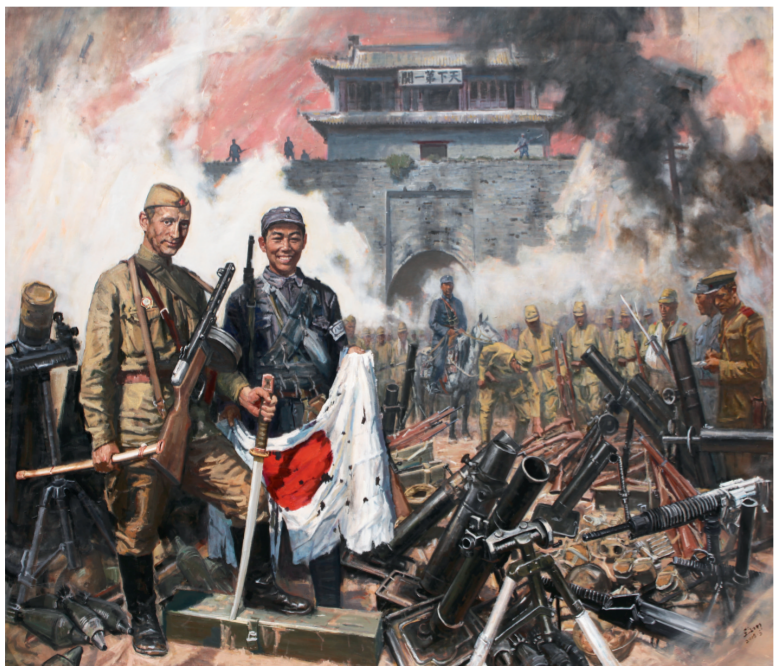
中苏会师解放山海关(油画) 215×250厘米 邵亚川