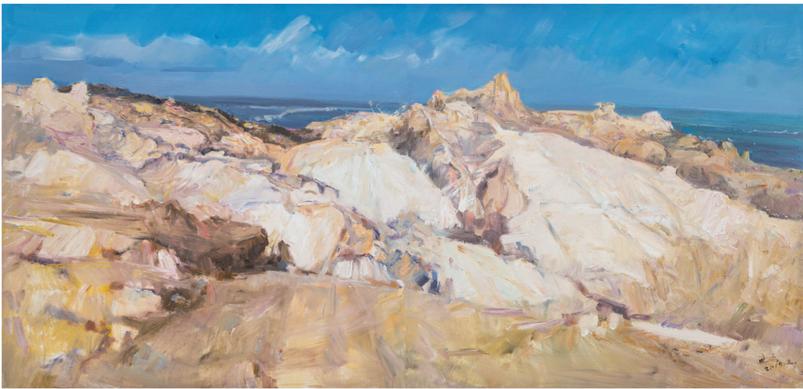
礁石浪痕(油画) 150×320厘米 2015年 范迪安

据悉,展览同时得到深圳市宣传文化事业发展专项基金的大力支持,在深圳展出后将在全国多个美术馆巡展。