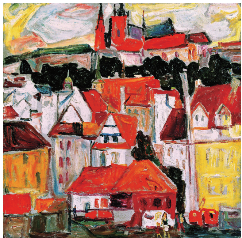
布拉格小景(油画) 75×75厘米 2006年 罗尔纯