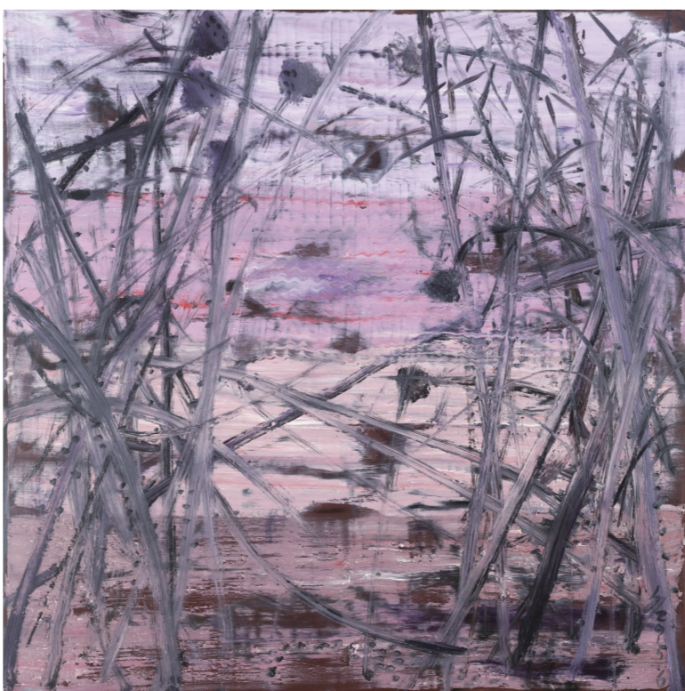
行·系列311(油画) 100×100厘米 文隼非