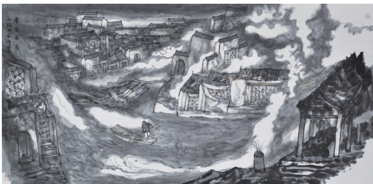
梦见南屏(国画) 50×115厘米 谢永增

我每次来屏山，都不愿走，住不够，虽然身为异乡客，却感觉回到了故乡。来到这里，就感觉找到了创作的源头。我这几年很多以“故乡”为主题的作品，其素材和灵感都来自于这里。自问为什么这么喜欢这里，很难说出理由，其实喜欢是不需要理由的——艺术如此，生活也是如此。