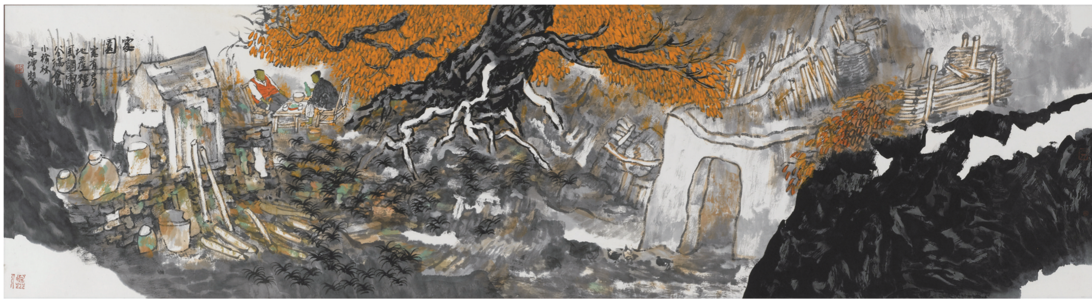
家园(国画) 45×180厘米 谢永增

谢永增，1961年生，河北深州人。北京画院专业画家、国家一级美术师、中国美术家协会会员。作品多次参加国内外重要美术展览，曾获全国首届中国山水画展银奖、第九届全国美展优秀作品奖、第二届全国画院双年展学术大奖、第二、三届全国中国画展铜奖、优秀作品奖等，作品被多个政府机构、美术馆、博物馆等收藏，出版多部个人画集。