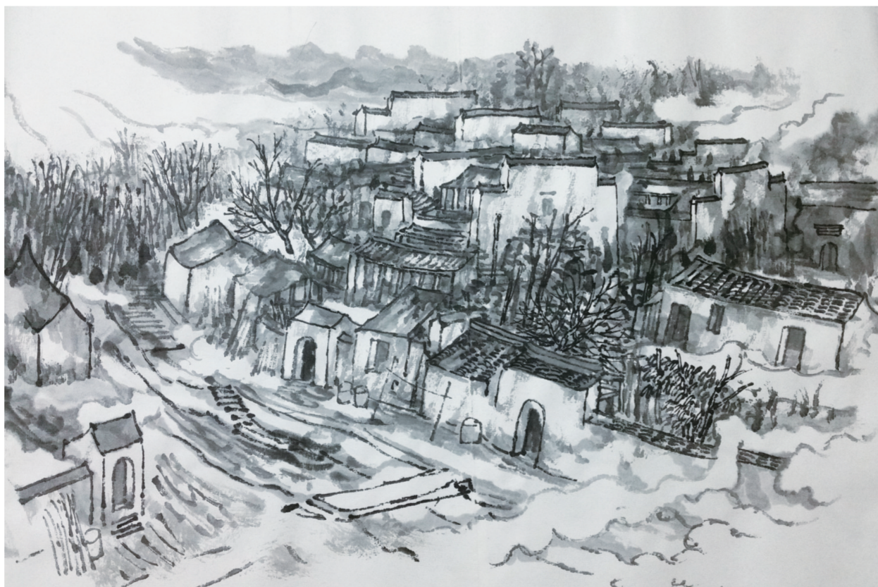
屏山写生之一(国画) 51×50厘米 谢永增