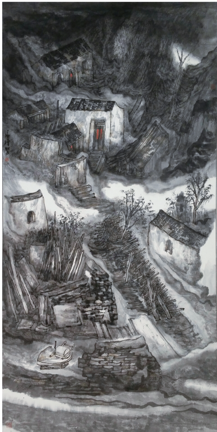
古北口的冬天(国画) 52×55厘米 谢永增