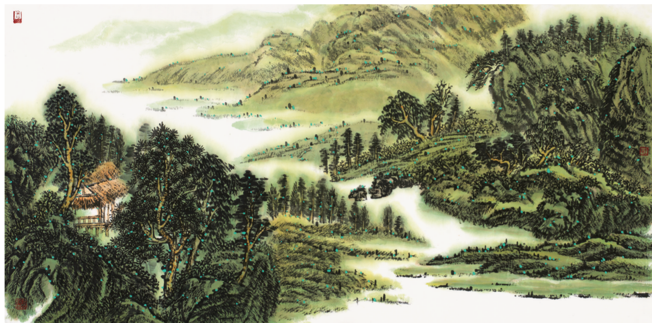
宁静的小河(国画) 68×139厘米 王晓