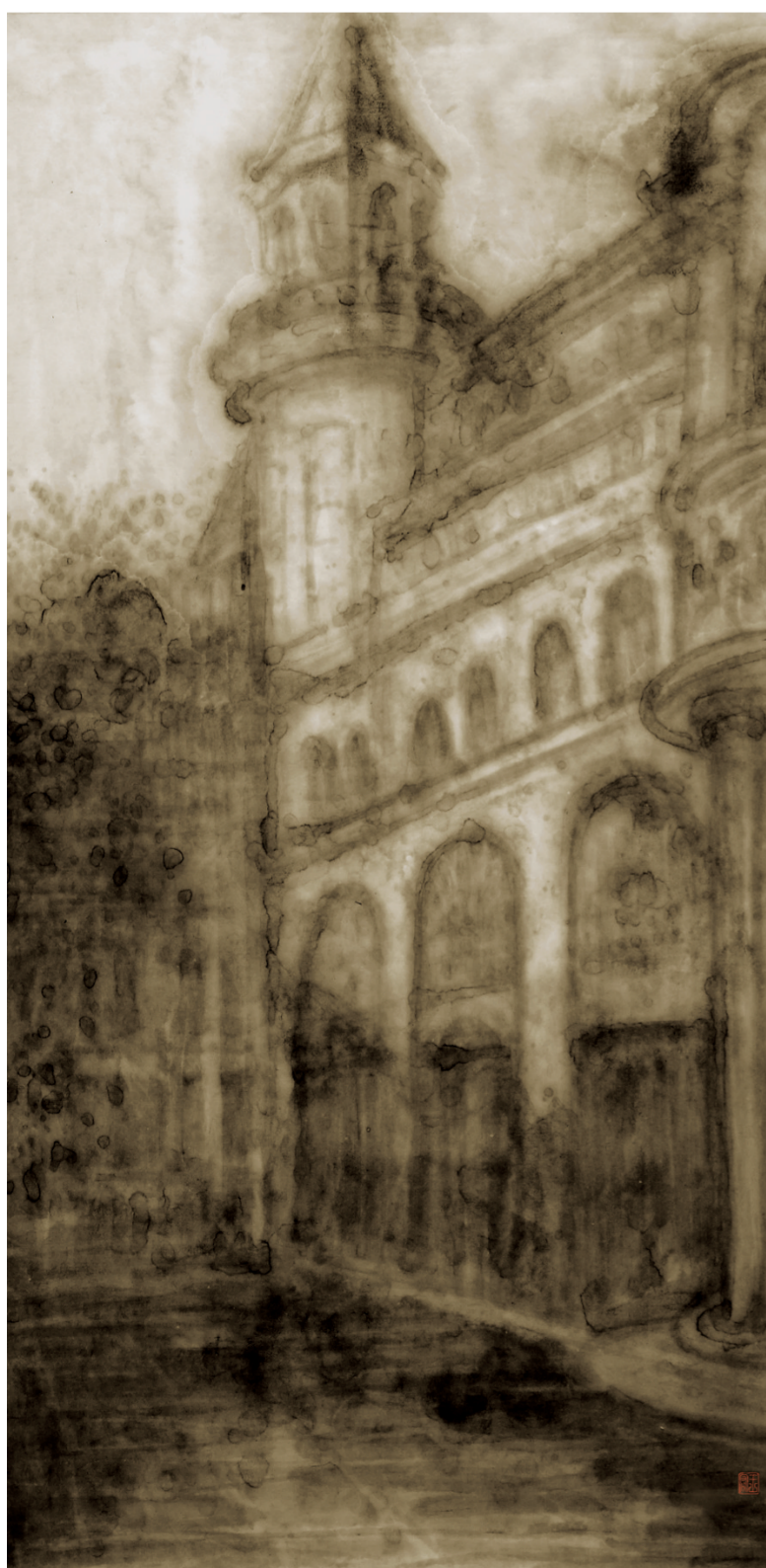
城市记忆系列之晨语(国画) 100×55厘米 王宏