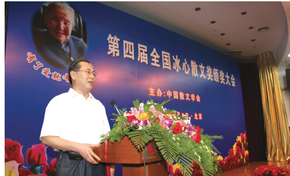
吕敬文《以经典的名义》获冰心散文奖。