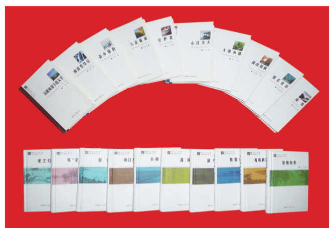
展示房山文学整体创作力量的两辑“燕都文丛”由33部文艺精品组成。