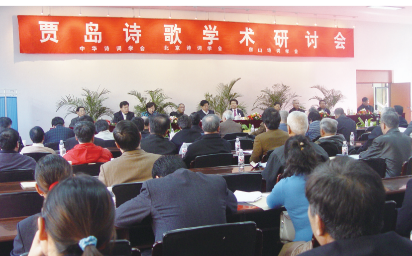
房山籍唐代诗人贾岛诗歌学术研讨会召开。