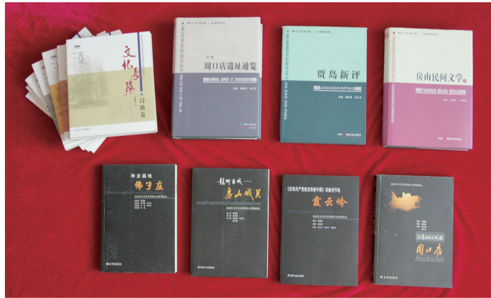
挖掘地域文化,撰写编辑房山地域文化研究丛书。