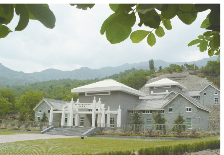
房山文联有展览堂上村《没有共产党就没有新中国》词曲创作地纪念馆。