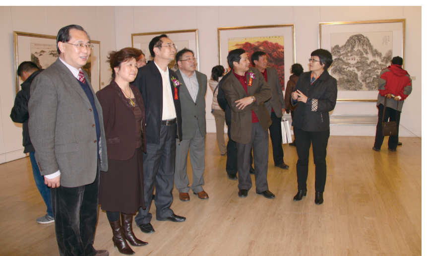
北京市和房山区有关领导在中国美术馆观看“北京意向·大美房山”美术作品展览。