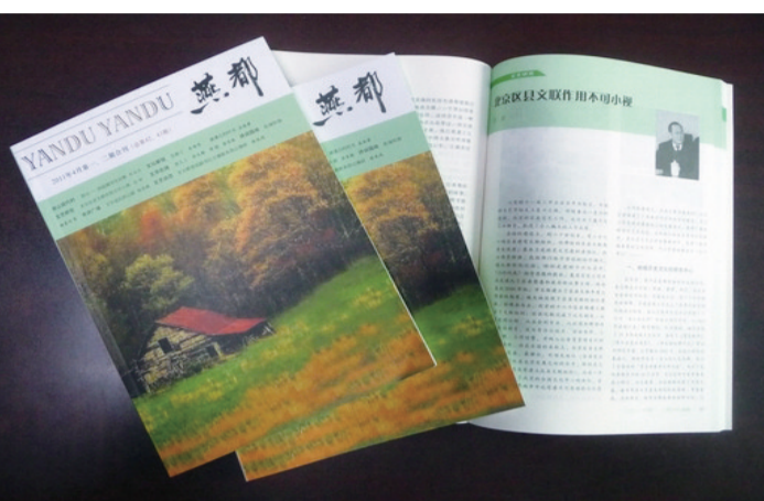
房山文联主办的综合性文艺双月刊《燕都》杂志。