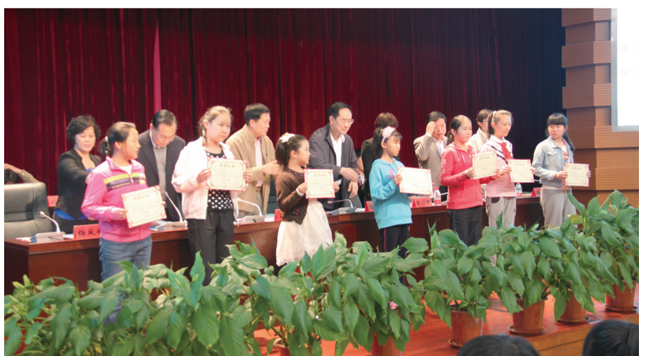
房山文联率先成立北京首个小作家协会。