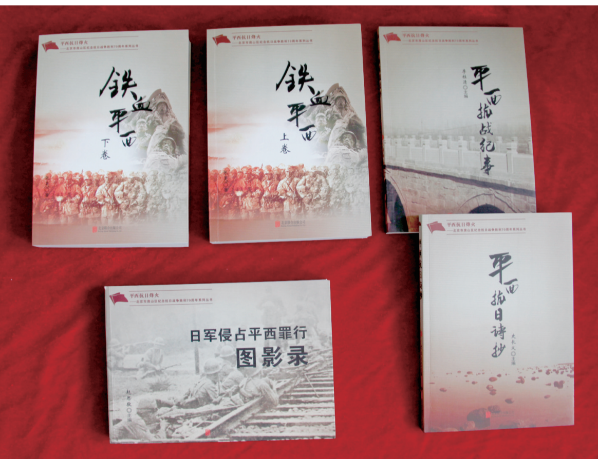
纪念抗日战争胜利70周年系列丛书。