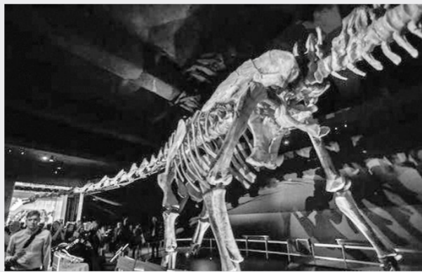
“泰坦巨龙”恐龙骨架

公园由景观设计师凯瑟琳·古斯塔夫森和尼尔·波特位于伦敦的工作室设计,园内植物将以当地常见植被为主。落成后的景观公园将呈现八件在“米兰艺术线”竞赛中胜出的艺术作品。该项竞赛由米兰市政府举办。