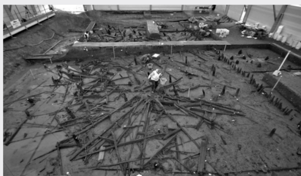
英国出土的青铜时代房屋

考古学家认为,一场大火导致当时的房屋坍塌陷入河流中,但因淤泥的覆盖使得搭建房屋的木料保存完好,现场还挖掘出一些装有食物的器皿。另外,考古学家还在两米深的地下发现一些脚印,或为当时生活在这里的人们所留下的。