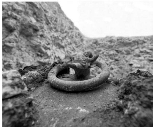
出土于法国凯尔特墓的青铜酒壶