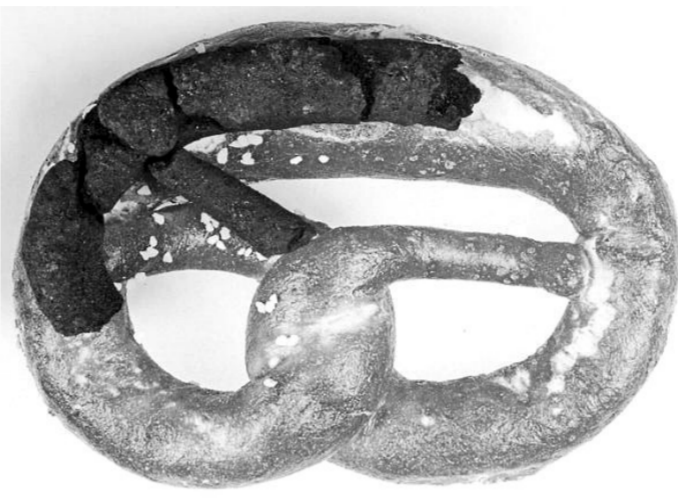
世界最古老的蝴蝶脆饼

虽然与直立人、能人等远古人类种类近似,但其特征是独一无二的。“纳勒迪人”的手和手腕的结构与现代人比较相似,便于灵活地活动,其足部和下肢也与现代人有些相似,不过其躯干、肩膀、骨盆和股骨等部位却比现代人原始许多。此外,从遗址的骨骼分布形态来看,该物种可能有摆放同类尸体的行为。