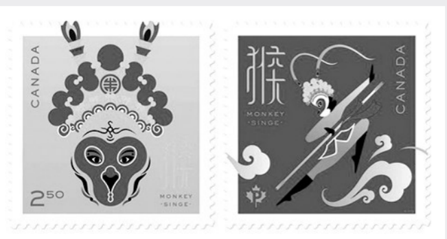
加拿大发行的中国猴年邮票

古生物学者推断,这头恐龙属于“泰坦巨龙”。据称,当时在挖掘现场共找到223块化石,其中包括一个约2.44米的巨大腿骨,它独特的形状和尺寸使古生物学者相信他们找到了一个新的物种。