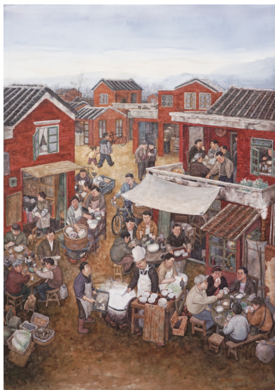
日出而作——早饭(水彩) 110×80厘米 2015年 苏军权

晓曙认为，我国水彩画发展经历了引入期、发展期和近10年以来的鼎盛期3个阶段，当下水彩画风格和面貌已呈现出百花齐放、百家争鸣的态势。“当前主要特征是在表现题材上几乎可以和油画、中国画齐头并进，这两个画种所涉猎的题材，水彩画几乎都已涉猎，完全改变了过去水彩画只表现‘小桥、流水、人家’，‘少女、鸡犬、鲜花’的局面；从绘画技法来看，水彩画语言已完全成熟，具有强大的表现力，几乎可以和油画相提并论。近十几年来，随着大幅水彩纸的出现，水彩画家们可以很方便地创作巨幅作品，突破了过去‘小品’的概念；从绘画形式而言，写实、意象、变形，甚至抽象画的表现，在当下水彩画中屡见不鲜，水彩画已进入全新阶段；绘画风格的多元在水彩画创作中已成为画家的追求目标。”汪晓曙说，水彩画“格局不大、创造性不强”的认识已成为过去。