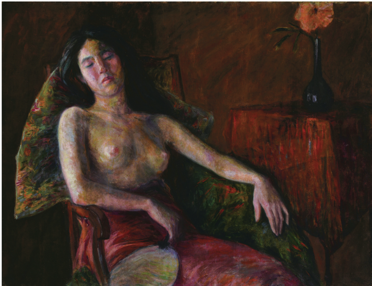
半裸女像(油画) 90×116.5厘米 1909年 李叔同

起点，五口通商更使之成为东西文化交汇的前沿，随着“西学东渐”，油画传入并在这片热土上扎根结果。作为本市最具代表性的品牌文化窗口单位之一，宁波美术馆担当梳理地方艺术史、培育艺术队伍的重任，近年来通过主办各项油画作品展，强化了宁波与国内外油画界的交流与互动，有效推进宁波市以至浙江省油画艺术的发展。