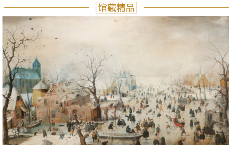
严冬景致中的滑冰者(油画) 1608年 亨德里克·阿维坎普 荷兰国家博物馆藏

展览期间，《中国水彩画年鉴2015》首发仪式、中国美协水彩画艺委会年度会议、展览学术交流会相继举办。同时，莞城美术馆还将举行水彩画沙龙、水彩创作交流会、扎染艺术体验和手工明信片DIY等公益活动。