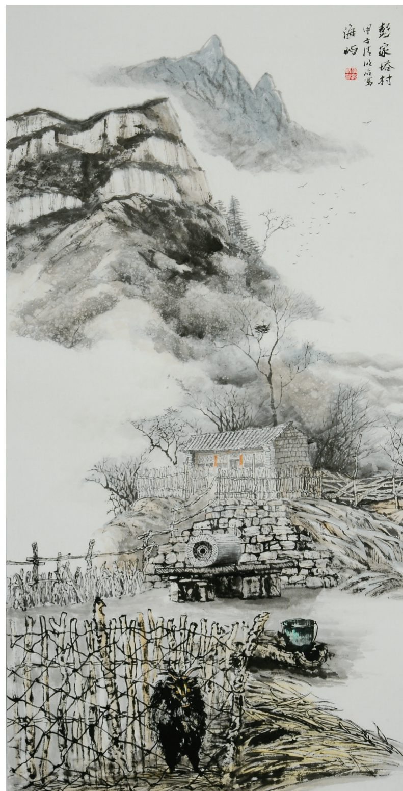
彭家塔村(国画) 138×69厘米 李海屿

海屿热爱他生活着的那片黄土地，更喜欢表现那里的一草一木。无论春夏秋冬，他总爱约上三五好友外出写生，把山水的精灵印入脑海，通过绘画抒发自己的胸臆。海屿近年来的山水作品，张张都有新意。他在开辟自己的新路，一步步形成迥异于他人的山水面貌和艺术风格，愿他的路子越来越宽广。