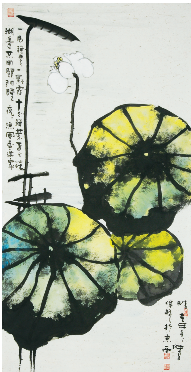
一片秋声(国画) 145×74厘米 徐保林