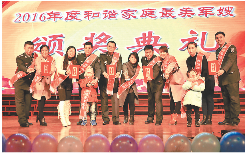
每年一届的“最美军嫂、和谐家庭”表彰会，成为最暖心的教育。

俗话说，观念一新，遍地是金。地处偏远山村的陆军第16集团军某装甲旅，秉承“老实、扎实、务实、踏实”的精神，牢固树立“只有正规发力才能整装出发，只有按纲办事才能破浪前行”的理念，铁心抓法治、强力抓正规，使部队精神风貌焕然一新。3月2日，该集团军在旅里召开了正规化管理建设观摩会。