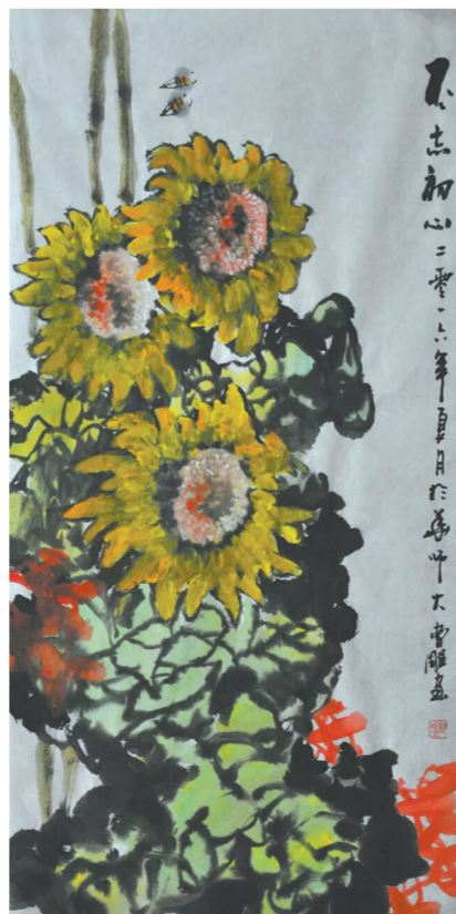
《不忘初心》 100厘米×50厘米