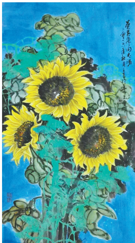
《葵花朵朵向阳开》 100厘米×50厘米