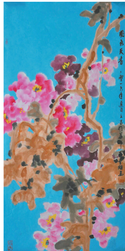
《国色天香》 100厘米×50厘米