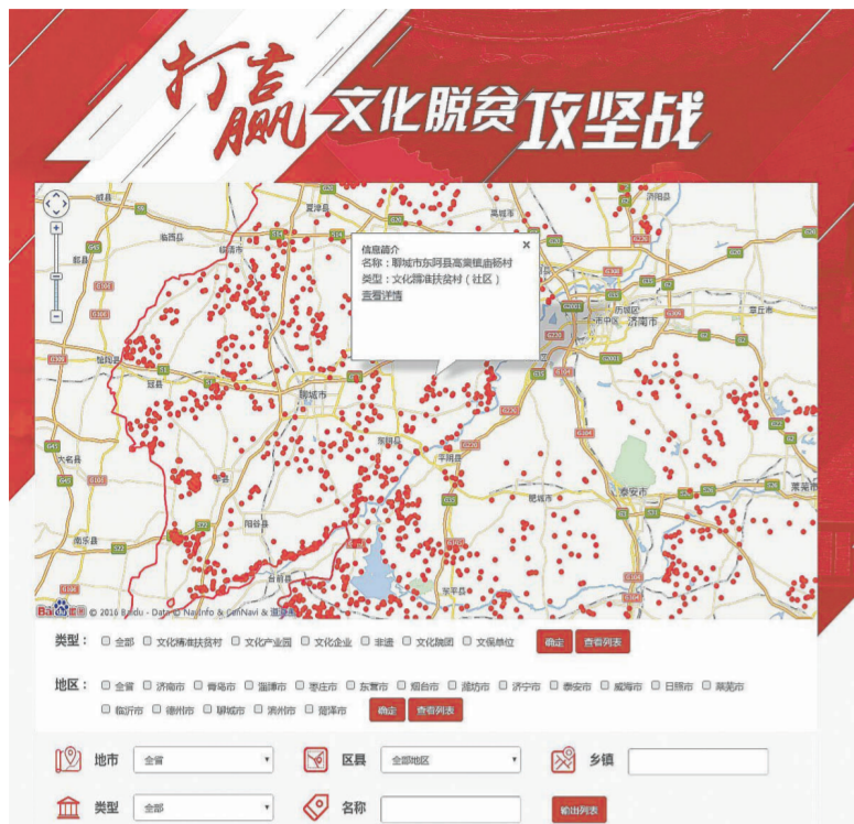
山东省文化厅官网上的文化精准扶贫地图

文化精准扶贫地图什么样?打开后可以查询贫困村的地理位置,同时村子周边的文化资源一目了然,贫困村当前的文化基础条件和扶贫情况也一一在列。山东省文化厅官网上的文化精准扶贫地图是山东开展文化扶贫的一个标志。山东省文化厅负责人介绍,地图上的一个个小红点,预示着文化扶贫需要踏踏实实、一步一个脚印地往前走,不能让一个村掉队。