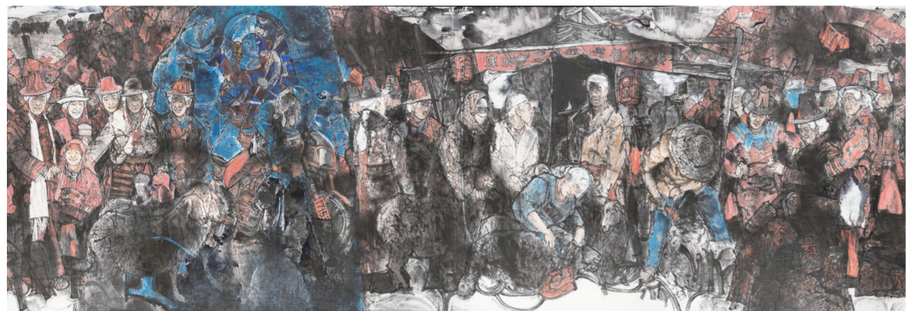
赛汗塔拉草原牧民的夏收 240×720厘米(国画) 2016年 张兴国(主创)、张建中、张宪文、曹瀚(合作)

11月24日,由中共甘肃省委宣传部、甘肃省文化厅、甘肃画院主办的“朝圣·敦煌——甘肃画院美术创作工程:甘肃画院美术作品展”在中国美术馆开幕,共展出30余位画家的作品百余幅。本次展览是对“朝圣·敦煌——甘肃画院美术创作工程”实施6年来的一次总结,艺术家们在创作中注入敦煌元素,融汇敦煌精神,接续文化正脉,突出地域风貌,通过各自不尽相同的理解和语言叙述,展现了21世纪中国当代美术的新敦煌风貌。这也正是“朝圣·敦煌——甘肃画院美术创作工程”的主题方向。