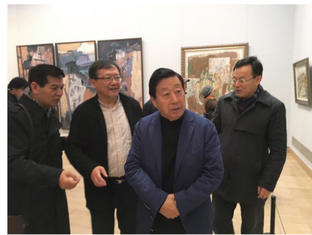
中国文联副主席、中国美协主席刘大为等参观展览