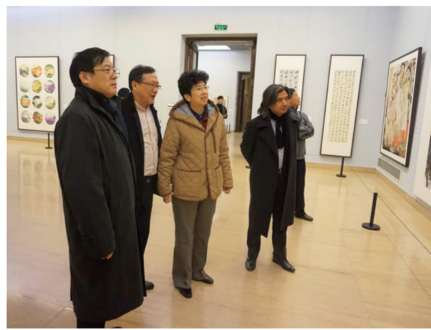
中国文联党组书记赵实等参观展览