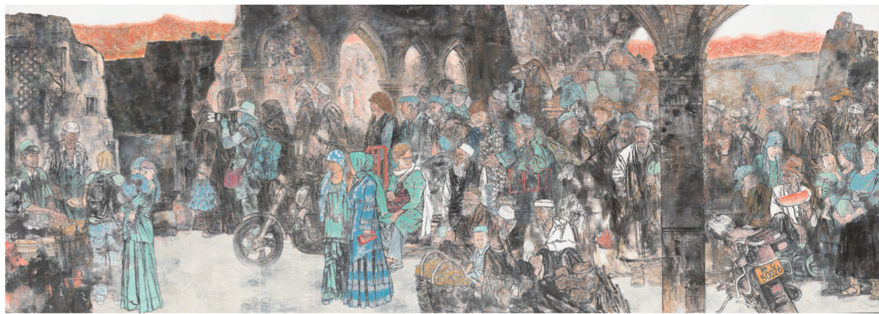
丝路新貌——大巴扎 240×720厘米(国画) 2016年 王梦彤(主创)、毛志成、范文阳、张生进(合作)