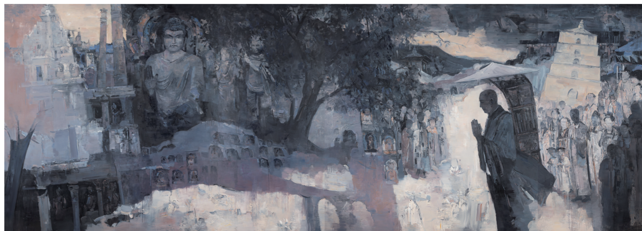
西行求法 260×720厘米(油画) 2016年 许翰政(主创)、房建平、韩君(合作)