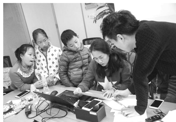
平台测试 家长与孩子一起参与腾讯游戏成长守护

为协助家长对未成年子女的游戏账号进行健康行为监护,在文化部指导下,网络游戏未成年人家长监护工程之腾讯游戏成长守护平台( http://jiazhang.qq.com )2月16日正式上线。腾讯集团高级副总裁马晓轶表示,希望通过该平台帮助父母与孩子更好地沟通,更多了解孩子,也更加安心地让孩子接触和体验网络游戏。