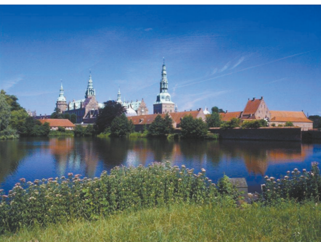
丹麦的田园风光陶醉游人