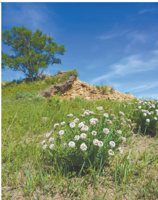
微风吹拂天下的野花

水泉沟位于怀柔、昌平、延庆交界处的一条小型峡谷,高崖陡峻,野树森森,溪流婉转。由于原始神秘,风光不错,又尚未被开发成景区,被京城的户外