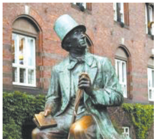
安徒生是为童话而诞生的伟大作家