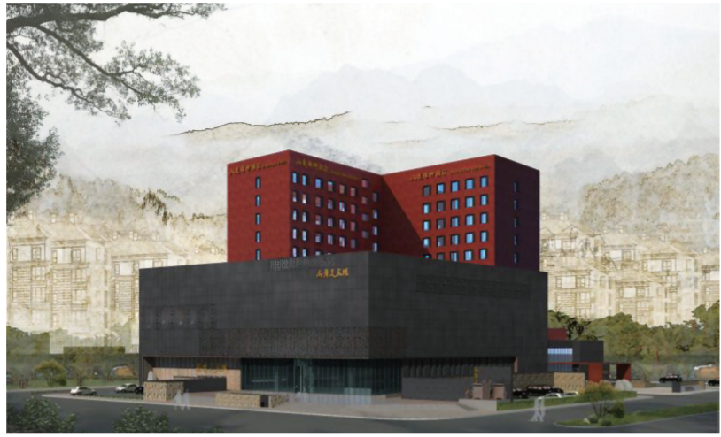
哈尔滨禹舜美术馆外景

同时,美术馆恰好坐落在利民新区大学城,这里以哈尔滨师范大学为龙头,现在已经发展到有22所高校、十几万学生了。基于此,我们依托大学城,承诺禹舜美术馆面向高校资源共享,还可将此写入招生简章中。这样一来,这些院校和美术专业相关的学生很受益,