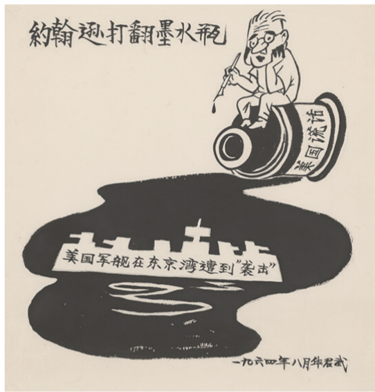
约翰·打翻墨水瓶(漫画) 1964年 华君武