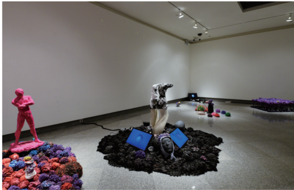
极限扩张的简单动作(视频、黏土装置) 2015年 谭英杰

的对象,在对国内以“70后”“80后”为主要创作力量、与雕塑媒介领域相关的当代艺术现场进行梳理和分析后,最终确定了25位在这一领域有着实验性、媒介拓展性,在创作中对艺术的生长及其空间之间的关系有着持续的思考,并且已经形成了自己独特面貌和审美品格的优秀青年艺术家参展。作为一个以物质性和空间性为特征的媒介,相比较而言,“雕塑”在当代的步伐可谓“超前”,然而随着“雕塑”材料中现成品的介入,以及“公共艺术”的兴起,“雕塑”媒介泛化引发的一系列学术问题也浮出水面。那么如何理解“雕塑”与“装置”以及与“公共艺术”之间的关系?当代文化语境下,如何看待传统雕塑的“公共性”与“空间性”?特定空间中,“雕塑”发生的可能性和必然性是什么?当代科技与社会的发展为人类提出了怎样的“空间性”问题,青年艺术家又是怎样“聪明”地循着学理的脉络完成了雕塑语言的当代转换……都是本届“在路上”关注并集中讨论的问题。