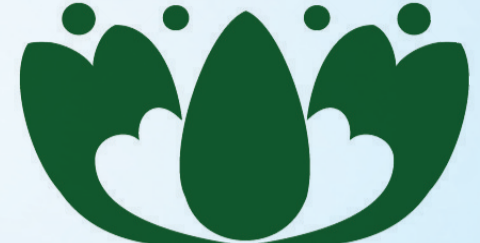
雨花慈善工程和 雨花行动公益基金标识图案