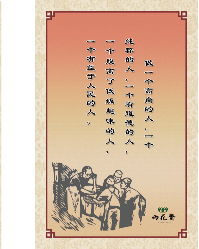
第一个雨花斋公益餐厅悬挂着雷锋和白求恩的画像,由雨花义工创作。