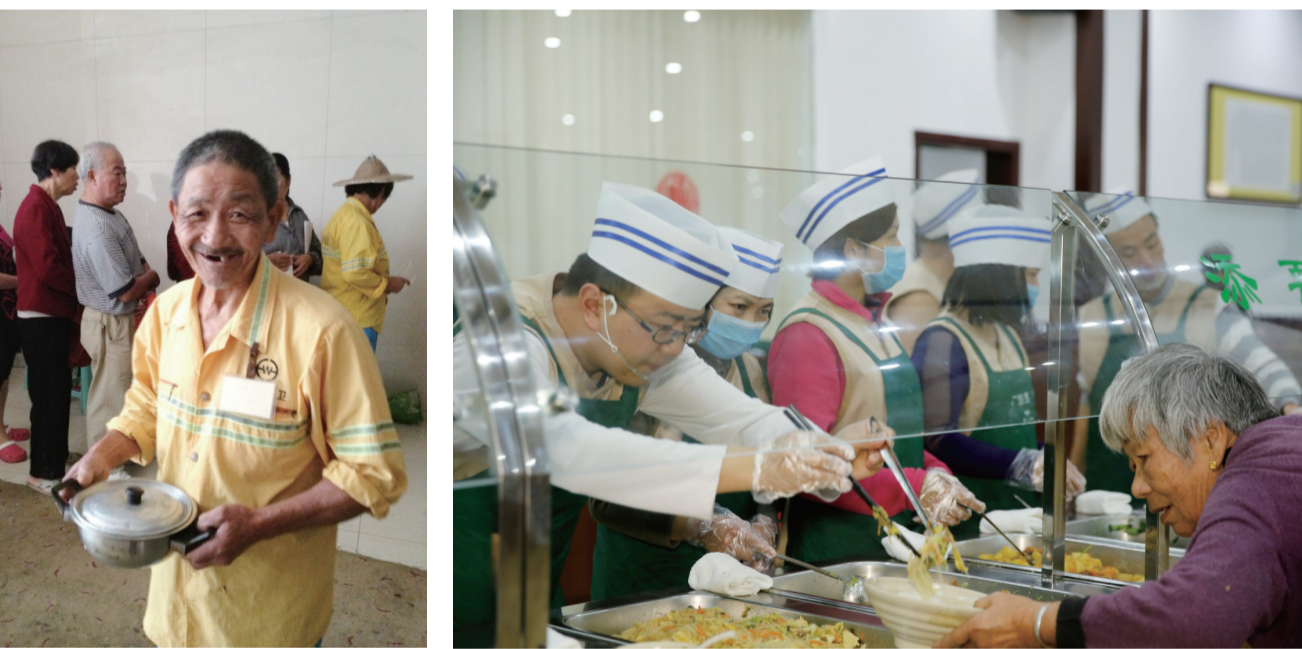
一位老年环卫工人在雨花斋公益素食餐厅打了饭菜

雨花基金的行动宗旨是:做微公益、扬慈善,真公益、真慈善,拒虚交易。反对以公益慈善为名盈利的任何举措。 雨花基金的行动标准是:“由内向外”,即指公益慈善行动必须先由雨花基金的成员自身出资、出力、出物,在此基