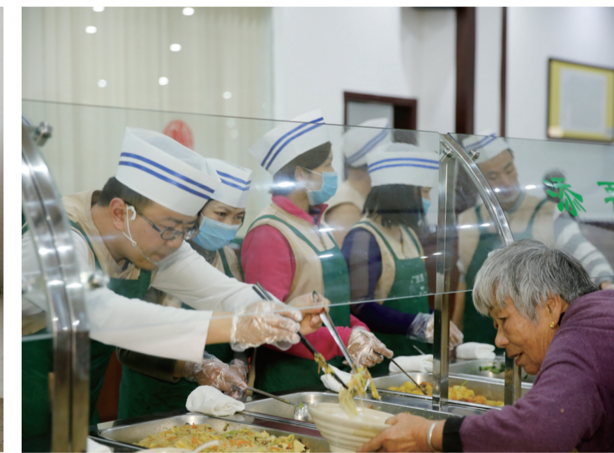
恭敬向老人提供素食的雨花斋义工