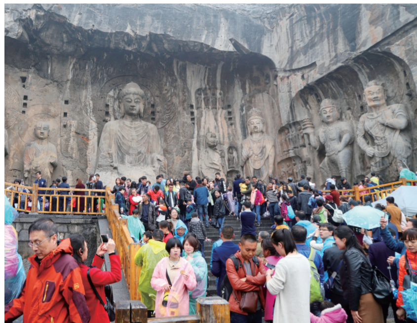
清明小长假品质游成趋势