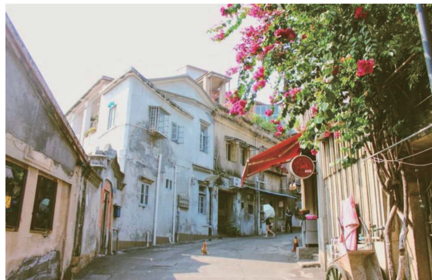
厦门街景独具特色

放眼当下，大多数地方仍以生态山水游、休闲农业游和文化观光游为主，而这恰恰是厦门旅游的短板。可喜的是，厦门岛—鼓浪屿作为厦门旅游的母体支撑，是厦门旅游的亮点，也是其他地方难以比拟的。