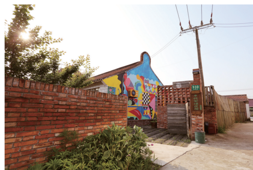
乡创既要体现乡村的清新和畅爽，也要呈现乡村文化的延续。

我们还要认识到，乡创大多围绕着不断成长的乡村生活。发展乡创应慎用原真性，尤其是原真性很容易成为民族村寨进步的沉重负担，然而，究竟有多少旅游者真正关心文化符号和可视化文化形式背后的真正意义却未为可知。所谓的原真性及迎合游客而构建出的原真性，很有可能是无意义的原真性，也很可能会造成今天延续昨天故事的“文化停滞”和在这里延续着那里故事的“文化变异”。