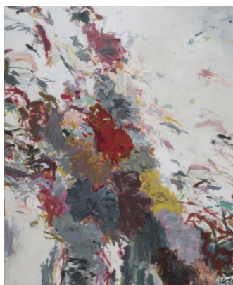
黄渊青《无题2014-15》130×110厘米 丙烯布 2017年(左) 王克举《十月天》80×100厘米 布面油画 2014年(右)

“江左风华”展出所在地雅达文化艺术中心位于雅达国际健康生态产业园的白马湖畔。雅达·乌镇项目位于浙江省桐乡市乌镇镇,规划用地1500亩,总建筑面积85万平方米。该项目被先后列为浙江省重点建设项目、浙江省服务业重大项目、浙江省重大产业项目。