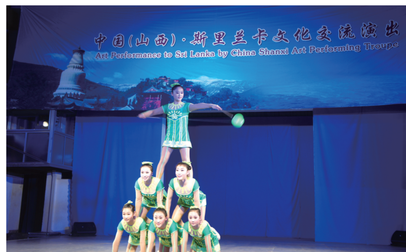
太原市歌舞杂技团赴斯里兰卡进行文化交流演出。