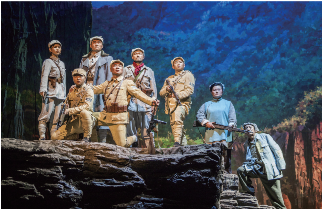
话剧《谋杀》是太原市话剧团为纪念抗战胜利70周年专门创作的作品。