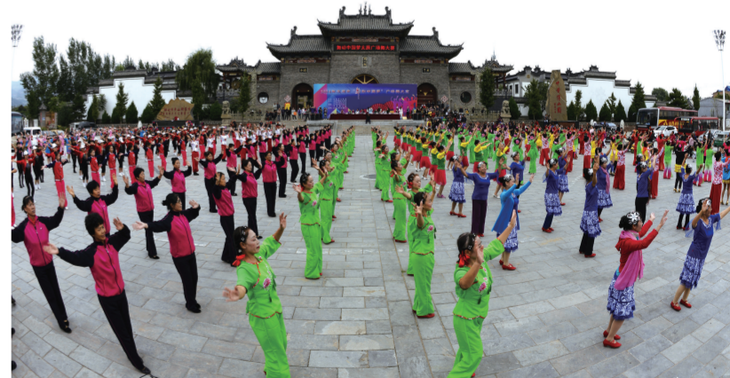
太原市“舞动中国梦”广场舞大赛