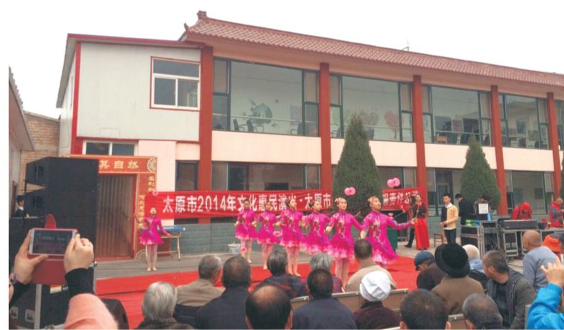
太原市文化惠民活动志愿服务站