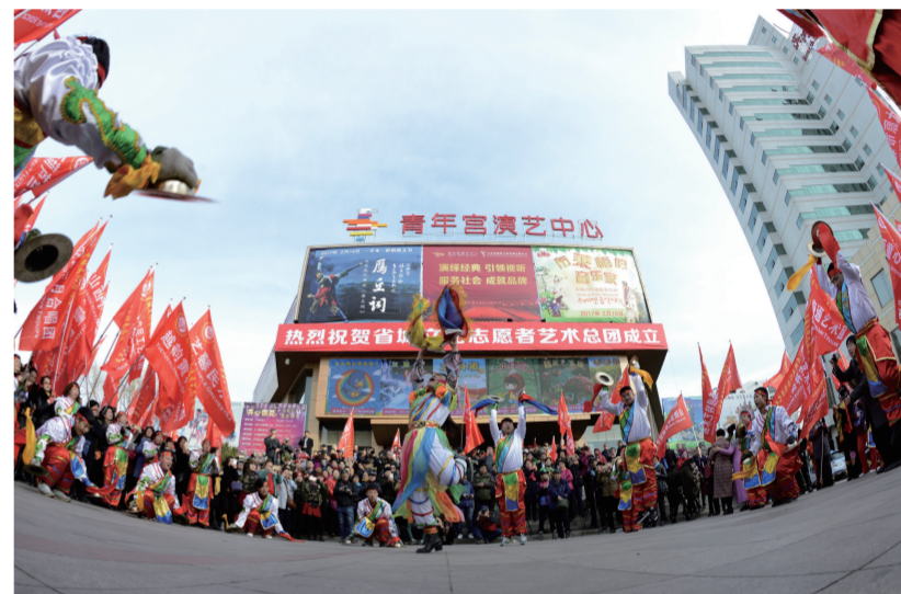
太原市文化志愿者艺术团成立

太原市常年利用传统节日和重大纪念日开展文化活动,连续多年举办“文化太原·幸福龙城”春节元宵系列文化活动、广场文化活动、太原庙会、锣鼓邀请赛、“书香太原、全民阅读”活动、非遗展演展示等文化活动,形成了一系列文化活动品牌。同时,各级各类群众性自办艺术节、文艺比赛等群众性文艺活动遍布大街小巷、城镇乡村,满足了不同地域、不同群体的群众的文化需求。(张强)