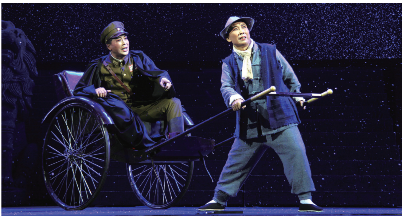
晋剧《续范亭》是太原市晋剧艺术研究院创作演出的作品,入选国家艺术基金2015年度舞台艺术创作资助项目。

山西太原是一座具有悠久历史的文明古城,对于黄河文化的形成和发展有着重要的作用。祖先们在这片土地上劳动、繁衍、生息,创造了灿烂的“旧石器文化”和“新石器文化”。太原迄今已有2500年的建城史,历史上的太原曾是9个独立王朝的都城或陪都,几度影响中国历史发展的进程。三家分晋,遂成战国七雄;李渊起兵,奠定大唐盛世;五代更替,促进赵宋统一;明清重镇,为我国北方屏障。这片广袤神奇的土地,山川毓秀、人文荟萃,不仅孕育了温彦博、狄仁杰、郭淮等政治家、军事家,也诞生了白居易、王之涣、王昌龄、罗贯中、傅山等诗人和文学家,为中华文化的发展进步做出了杰出的贡献。