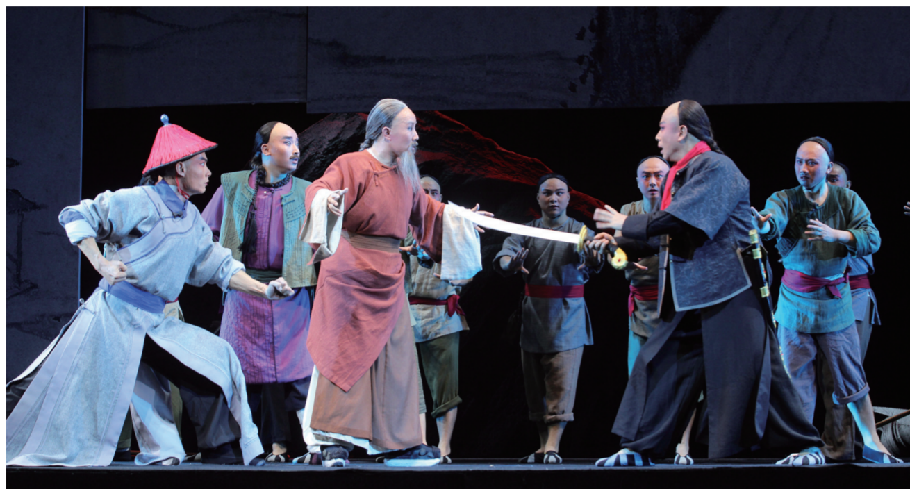
晋剧《于成龙》是太原市晋剧艺术研究院创作演出的作品,入选国家舞台艺术精品创作工程2016年度十大重点扶持剧目。