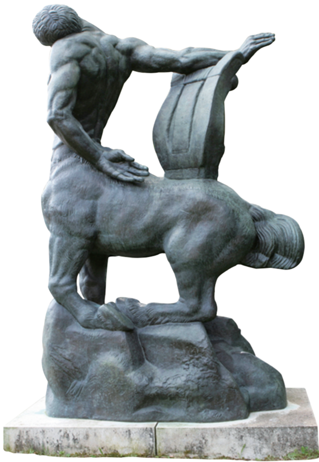
垂死的人马(雕塑) 1914年 安托万·布德尔

此次展览集中展示了布德尔所创作的古希腊、古罗马神话题材雕塑作品。古希腊雕塑是布德尔从艺以来一直模仿学习的对象,他不断从这些雕塑的古典理想美中汲取灵感,无论是《帕拉斯》(阿波罗)《果实》,或是香榭丽舍剧院的浮雕及《垂死的人马》,都可窥见古希腊雕塑和建筑的影子。但布德尔在追求古典美的同时,也尝试打破理想美的古典艺术观念,他的雕塑洋溢着一种鲜明的现代视觉性。“西方雕塑在经历了古希腊、文艺复兴以及19世纪法国的辉煌时代后,进入了现代时期。一方