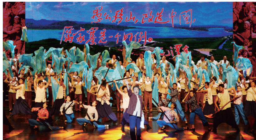
大型跨界融合舞台剧《沂蒙组歌》

第三是夯实人才基础，打造服务品牌，推动公共文化服务社会化。近年来，临沂市文化部门以夯实基层群众文化基础为抓手，打造了一批有临沂特色的公益文化服务品牌，推动了公共文化服务体系建设社会化健康发展。加强基层站点管理队伍建设。比如今年，当地加强对基层文化管理人员、文化带头人、志愿者队伍等的培训，逐步破解乡镇文化站长期在位不在岗、在岗不懂业务，基层文化人才断档、匮乏等难题，提升基层文化服务质量。今年8月，临沂市还对乡镇文化站、村(社区)综合性文化服务中心人员在岗及免费开放情况进行了抽查暗访，并在全市基层公共文化服务体系建设会议上进行通报，督促各县(区)及时整改。临沂市文广新局还与市委组织部联合，对全市各乡镇(街道)分管文化的乡镇长、文化站长等320余人，进行了公共文化服务保障法和基层公共文化服务体系建设的培训。此外，临沂市近年来还先后举办手工艺助力扶贫、文化产品电商平台、非遗传承人、小戏创作、广场舞等专题培训班12期，为基层输送了一大批文化人才。