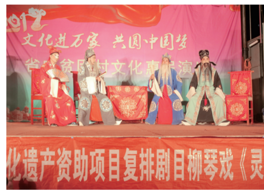
柳琴戏《灵堂花烛》演出现场