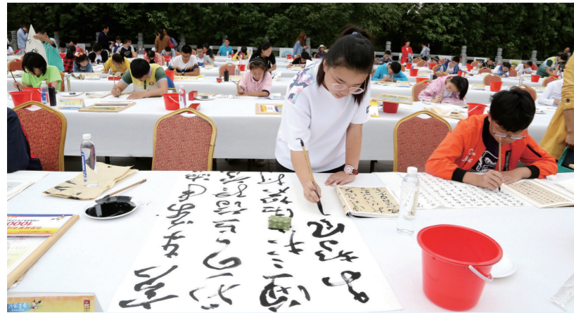
第十五届书圣文化节“百名书娃洗砚池雅集笔会”现场