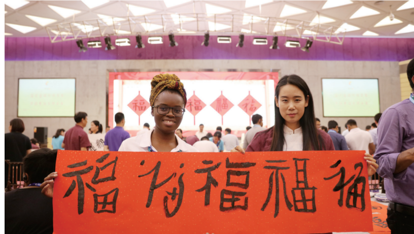
临沂美术馆金砖国家外交官论坛书法文化体验活动