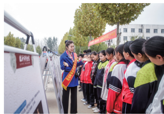
“流动博物馆”进校园