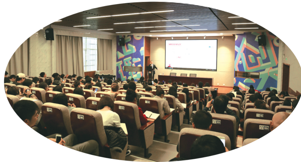
长沙天心文化产业园高级文创人才培养