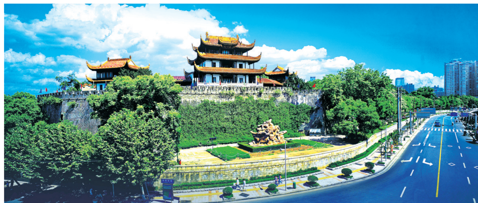
长沙天心文化产业园内的天心阁外景