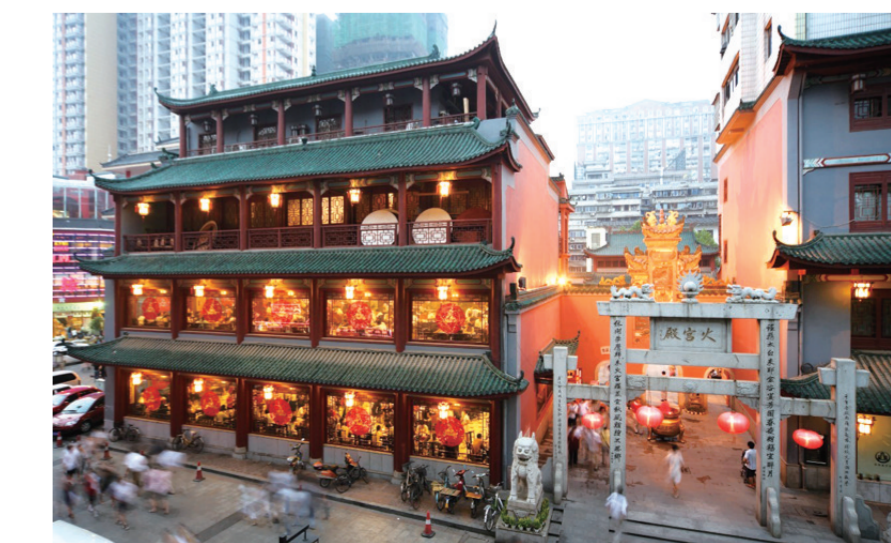
位于长沙天心文化产业园的火官殿

技融合发展，培育和引进艺尚源、永熙动漫、顺风传媒、景想传媒、中南国际会展、东道集团等一批文创设计企业，其中酷贝拉被授予“中国青少年体验教育基地”。