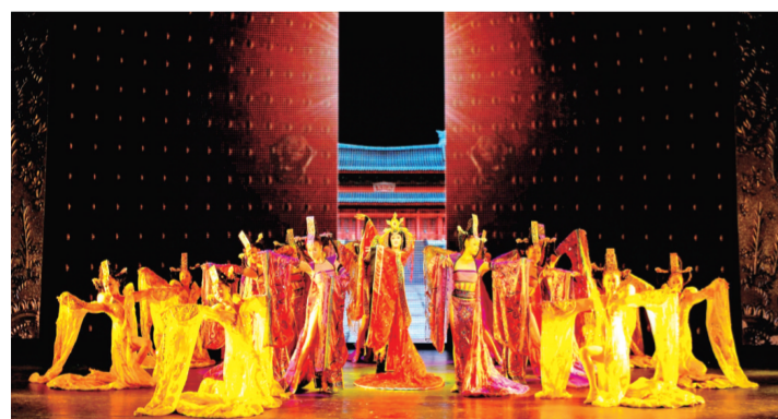
园区企业红太阳演艺集团推出的演艺节目