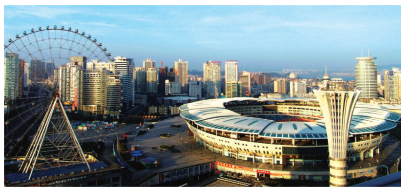
位于长沙天心文化产业园的新世纪体育文化中心