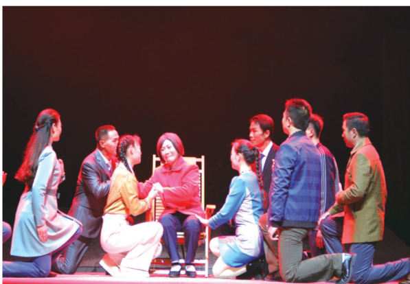
豫剧《嫂娘·大娘·亲娘》