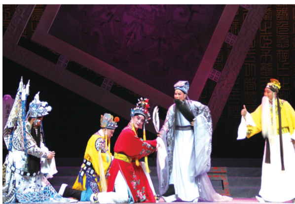
越调《诸葛亮一临危受命》

第十四届河南省戏剧大赛暨新创剧目展演活动已经落幕。河南省文艺工作者将不忘初心、牢记使命,坚定文化自信,以高度的政治责任感和历史使命感,担负起新的文化使命,推出更多“思想精深、艺术精湛、制作精良”,具有“中原特色、中原风格、中原气派”的文艺作品,以实际行动贯彻落实党的十九大精神,为决胜全面建成小康社会、夺取新时代中国特色社会主义的伟大胜利、实现中华民族伟大复兴中国梦作出更大的贡献。