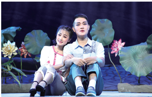
四平调《石磨的婚事》