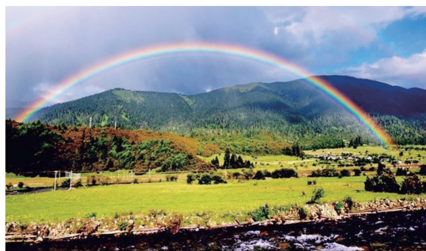
鲁朗小镇风光优美

随着近几年鲁朗的名气越来越大，旅游配套设施逐步完善，鲁朗小镇吸引了来自四面八方的游客和创业者，当地藏族民宿更是在援藏工作组的帮助下发展迅速。鲁朗，正在从一个高海拔偏远小山村向国际化旅游度假区大踏步地飞跃着。