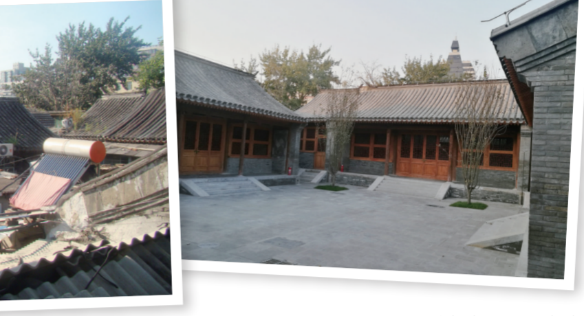
沈家本故居修缮前(左)与修缮后(右)

文物腾退，是文物保护工作中最难啃的硬骨头，也是历史文化街区保护和改造工作中的难题。许多登记在册的名人故居、会馆，现大多以大杂院的面貌呈现。如何做好腾退与修缮工