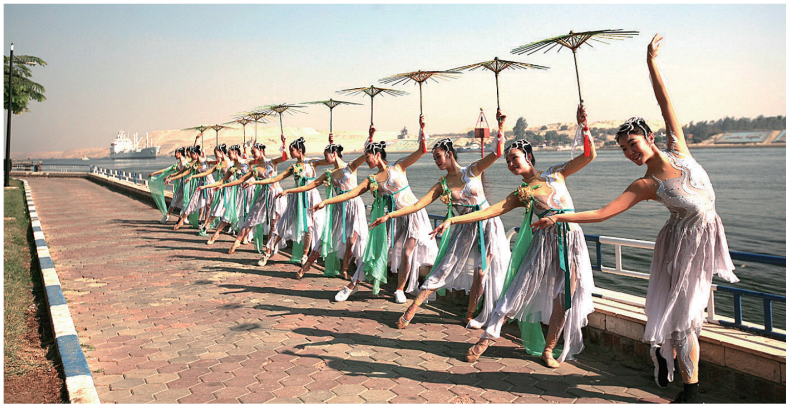
杭歌演员在苏伊士运河采风表演。

作为国家艺术基金资助项目,由杭州歌剧舞剧院(以下简称“杭歌”)创演的“舞蹈剧场”《遇见大运河》于今年11月25日至12月2日圆满完成赴埃及苏伊士运河的巡演和采风活动。埃及是杭歌2017年国际巡演的第三站;第四站希腊科林斯运河巡演即将于2018年1月中旬启程。