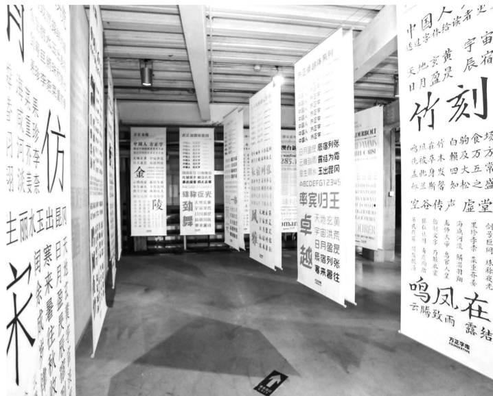
“字道2018”系列巡展现场