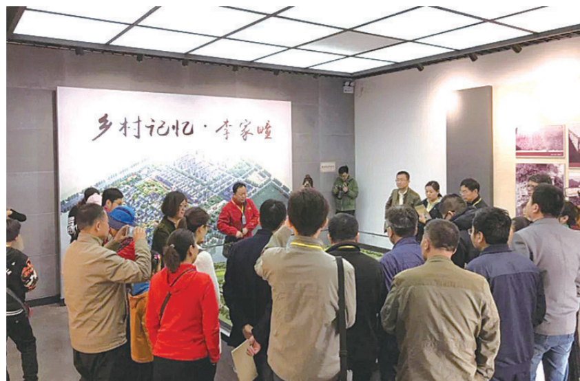
淄博市文物局、周村区文物局举办的“4·18”国际古迹遗址日参观体验活动现场。

南粤古驿道是以广东广州为中心,向东、西、南、北4个方向延伸形成的6条古驿道线路网络,包含了14条主线、56条支线,串联了广东省21个地级市103个区县的1200个人文及自然发展节点,包括202处古驿道及相关遗址、388处历史文化村镇等。4月14日起,广东省结合近几年开展的南粤古驿道保护利用工作,举办了南粤古驿道保护与修复利用研讨会等近10项国际古迹遗址日活动。“多年的修复利用,让古驿道‘留下来’并且焕发出新的活力,这是有形的物的传