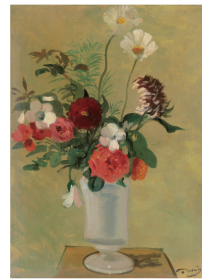
瓶中野花(油画) 1938年 安德烈·德朗