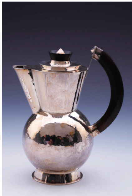
“生活世界:馆藏西方现代设计展”展出的葡萄酒壶

在一层展厅入口还设计了九门装置,门上装着由包豪斯首任校长格鲁庇乌斯亲手设计与锻造的合金门把手的复制品。铮铮铁骨,摆摆手迹,许江说,每次看到它,总感到一种包豪斯学院的清明之气,感到一种开启人类未来的不