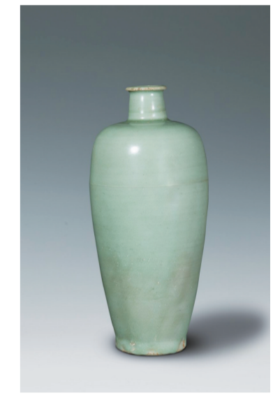
南宋龙泉窑青釉梅瓶