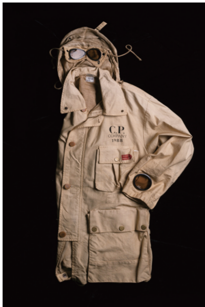
“颠覆与重塑:馆藏马西莫·奥斯蒂男装展”展出的护目镜夹克

凡力量。这正寓意着建造博物馆的初心和使命,希望中国和国际设计界、制造业从这里获得现代建造与中国创造的开启力量,同时也希望中国和国际教育界从这里获得生活技艺和生命启蒙的开启力量。