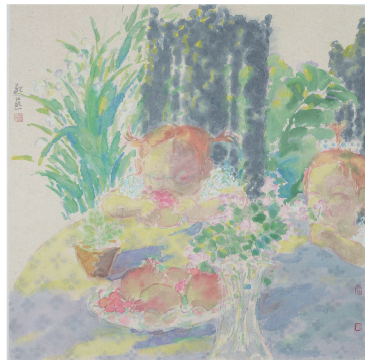
莱边女孩(国画) 96.5x70厘米 韦红燕