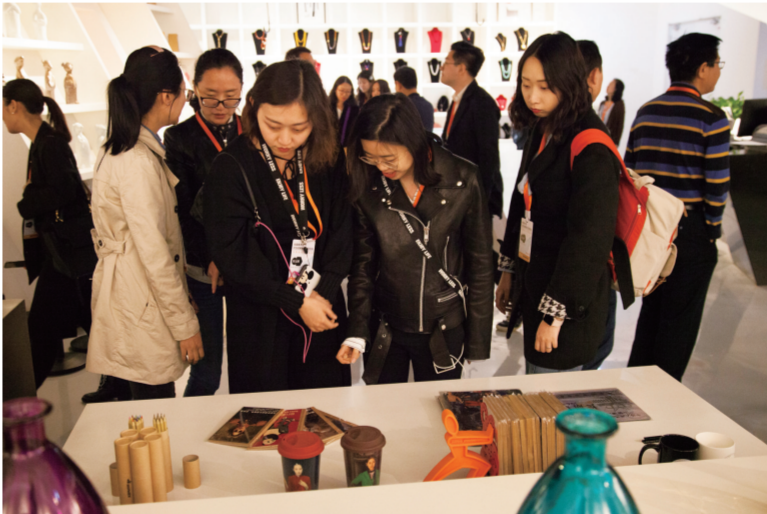
与会代表参观山东美术馆文创空间

首先，为了全面掌握全国文化文物单位文创产品现状，为文创工作发展寻找、总结可以借鉴的经验，山东美术馆