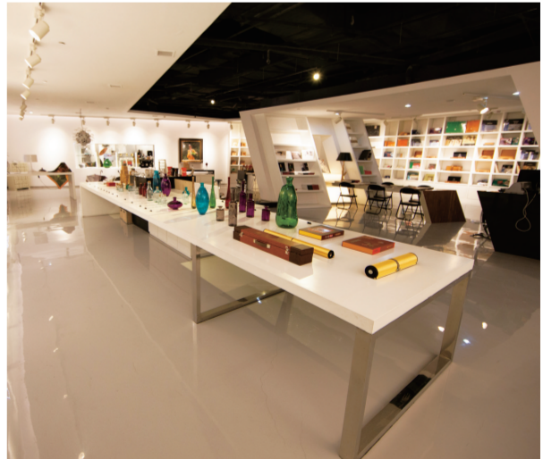
山东美术馆文创空间

除了科学的统计数据，山东美术馆二楼展厅里展示的全网19家知名美术馆的文创产品，可以让观众直观地感受到美术馆文创自《意见》发布以来的发展情况。依托馆藏资源，深度挖掘文化内涵；注重地域文化符号提炼，彰显中华多民族文化魅力；与有信誉的设计公司合作，注重文创产品品质等都有体现。美术馆文创与生活的关系