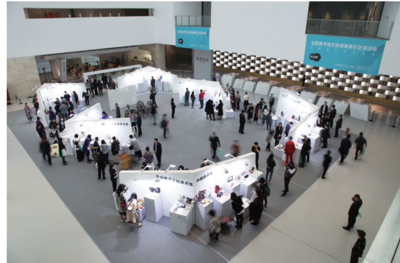
全国美术馆文创成果展示交流活动现场

艺术衍生品商店与山东省书画店相比，业务范围扩大很多，但不再出售布画等艺术原作，这种改变使美术馆职能与画廊完全区分开来。针对“第十届中国艺术节全国优秀美术作品展”专门定制的艺术衍生品，山东籍艺术名家的艺术复制品，充满设计感的家庭生活用品等组成了商店的业务主体，“十艺节”、山东文化等元素成为艺术衍生品